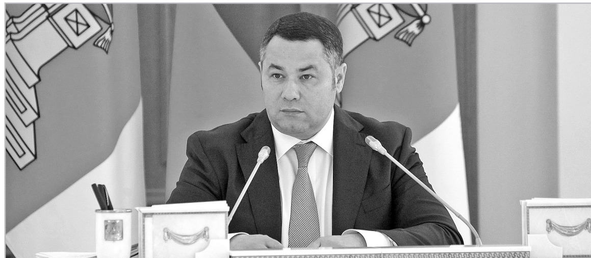
Губернатор Игорь Руденя 15 сентября подписал закон, предусматривающий сохранение региональных мер социальной поддержки женщинам старше 55 и мужчинам старше 60 лет

Соответствующий закон, с учетом его значимости, был принят региональным парламентом в сжатые сроки. Законопроект, над которым работали представители областного правительства и члены фракции «Единая Россия» в Законодательном собрании области,