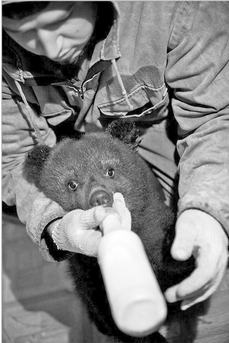
Биологи «Чистого леса» выхаживают медвежат-сирот, выкармливая малышей при помощи сосок

На просторы среднерусских лесов благодаря этой методике с биостанции за 25 лет выпустили 214 медведей в разных регионах России. Зоологи следят за судьбой питомцев, контактируя с лесниками и охотоведами.