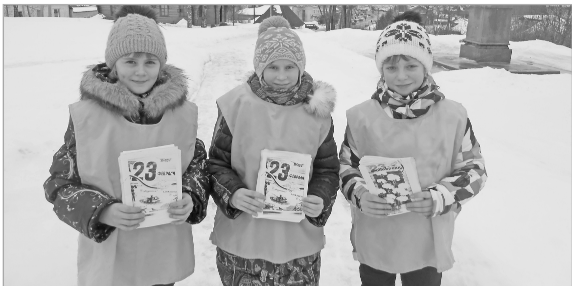
Юные жители поселка Кесова Гора помогают всем землякам – от мала до велика