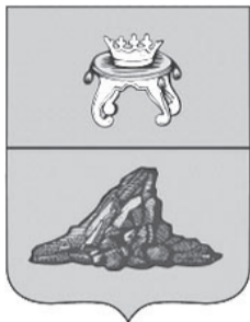
Герб Красного Холма

До 1776 года на месте нашего районного центра располагалось большое торговое село, которое вначале носило название Спас на Холму, а затем Красный Холм. Последнее название поселение получило, видимо, из-за красоты местности, в которой оно находилось. В старину слово «красный» означало «красивый». По крайней мере так считают многие краеведы.