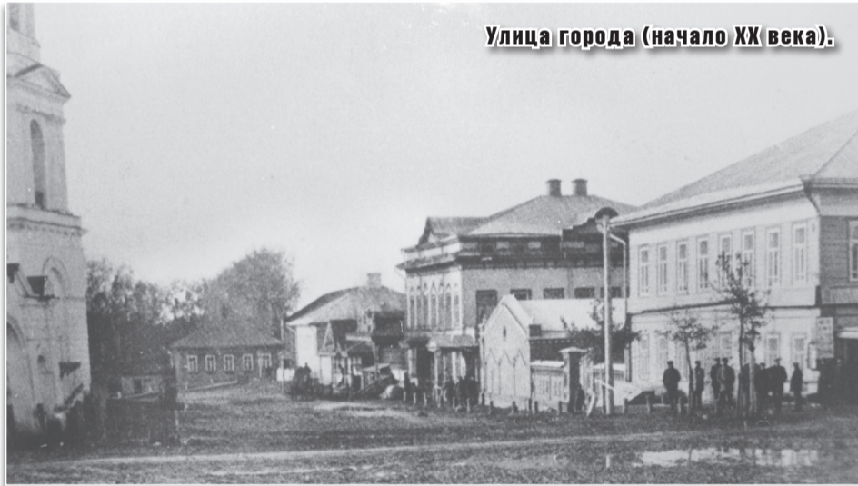
Улица города (начало XX века).