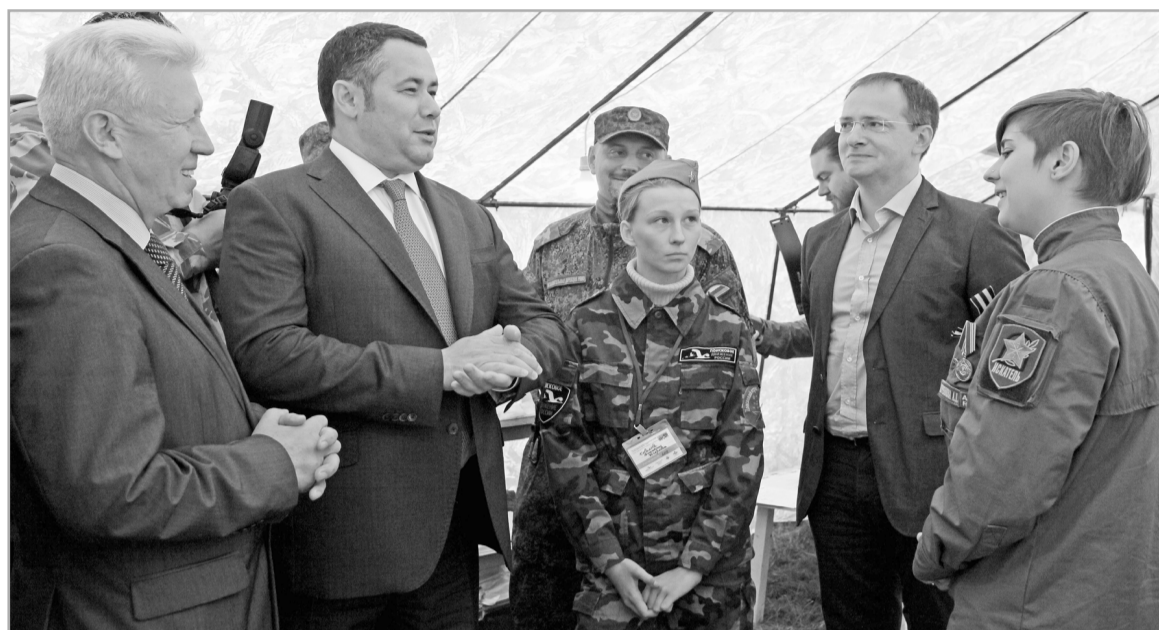
Патриотическому и духовно-нравственному воспитанию молодежи губернатор Игорь Руденя придает особое значение

Во-вторых, экономика. Промышленная политика Тверской области ориентирована на создание благоприятного инвестиционного климата, призвана стимулировать создание новых предприятий и реконструкцию имеющихся, и как следствие – значительно увеличилось количество рабочих мест во внебюджетной сфере. Подрастающее поколение будет обеспечено работой на своей малой родине. Выбор, куда пойти, останется за ними: на производство, в сельское хозяйство (там моло-