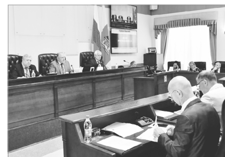
На пленарном заседании Законодательного Собрания Тверской области

Согласно предложенным в закон изменениям, в 2022 году предусматривается увеличение доходов областного бюджета на 6 млрд 879 млн руб., а расходной части – на 4 млрд руб.