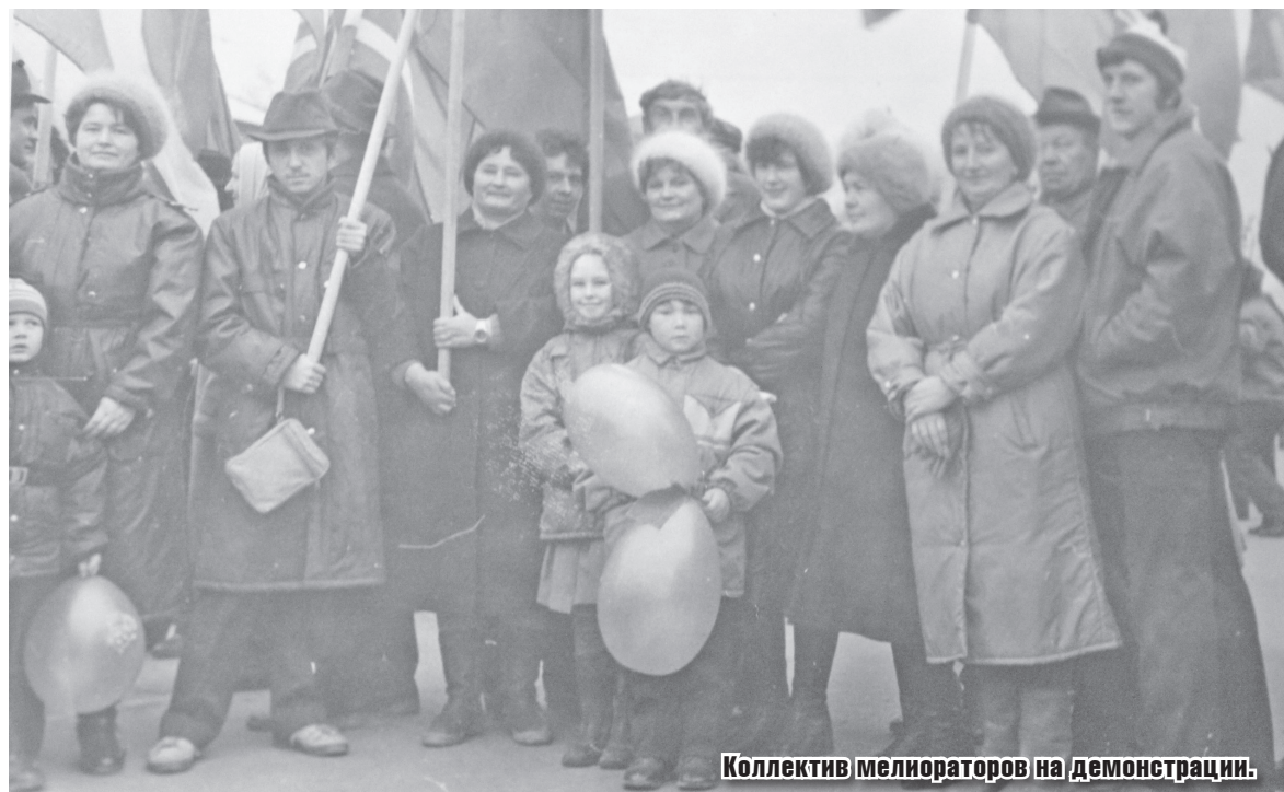
Коллектив мелиораторов на демонстрации.

Честь и хвала нашим передовикам, которые не раз получали значки, грамоты и подарки. Хорошая работа всегда поощрялась. Мой муж с товарищами по работе получили путевки на поездку в Москву, на матч спортивных команд ЦСКА – Спартак