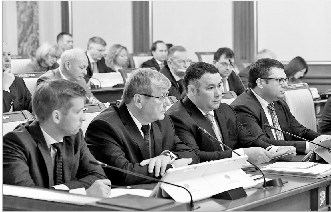
Игорь Руденя на заседании Правительства РФ рассказал об опыте Тверской области по переходу на цифровое телевидение

– Одна из стратегических задач состояла в том, чтобы устранить информационное неравенство для жителей страны, – подчеркнул вице-премьер. – Люди, которые живут в удаленных местах, в любой де-