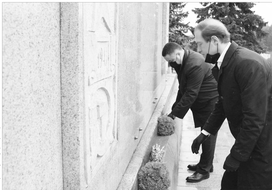
Губернатор Тверской области и министр промышленности и торговли Российской Федерации возлагают цветы к Обелиску освободителям Ржева

ентов с коронавирусной инфекцией была поставлена задача полностью обеспечить их функционирование. Признателем компании «Электромеханика» – предприятие первым подключилось к этой работе, за месяц здесь наладили производство сертифицированной продукции», – отметил Денис Мантуров.