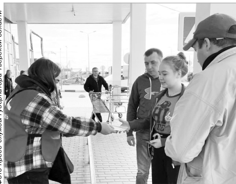
В праздничные дни маски раздавали у Торгового центра Леруа Мерлен в Твери

В первую очередь маски начали раздавать в муниципальных образованиях Верхневолжья, где была зарегистрирована коронавирусная инфекция, затем акция охватит все 42 муниципальных образования региона. Каждая многоцветная маска находится в отдельной упаковке, куда вложена инструкция по ее использованию. К участию в акции присоединились не только волонтеры, но и сотрудники патрульно-постовой службы, работники МФЦ.