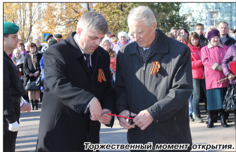
Торжественный момент открытия.

И вот открытие, о котором заблаговременно сообщила наша газета. Еще вчера шел дождь, на улице было сыро и неприятно. А тут, в торжественный день для краснохолмцев, уже с утра радостно, не по-осеннему светит солнце. Позолотом отсвечивали деревья в сквере. В общем, все способствовало этому событию.