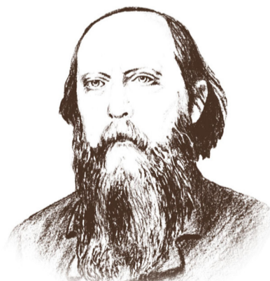
М.Е. Салтыков-Щедрин редактор газеты «Тверские ведомости» в 1860-х годах

«Тверские ведомости» много пишут про жизнь в районах области, поэтому сегодня их выписывают во всех муниципальных образованиях Верхневолжья. Приятная новость: подписка на 1-е полугодие 2015 года уже началась, цена на газету снижена.