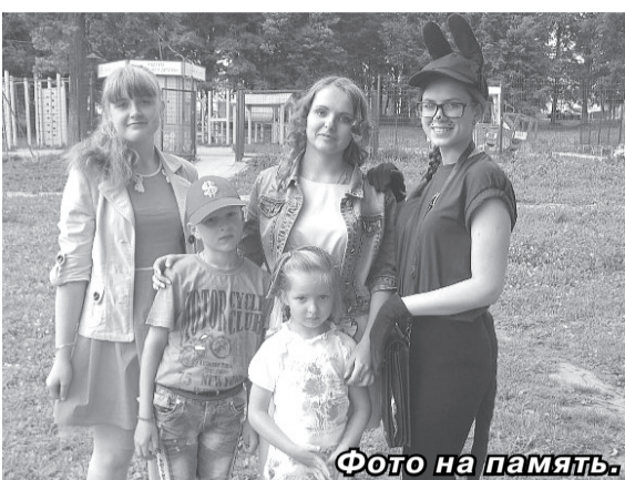
Фото на память.

Дважды нам довелось проводить спортивно-развлекательную программу «Выходи гулять во двор». Первый раз – в День молодежи для детей, живущих в поселке Неледино. Девтора из всех близлежащих домов