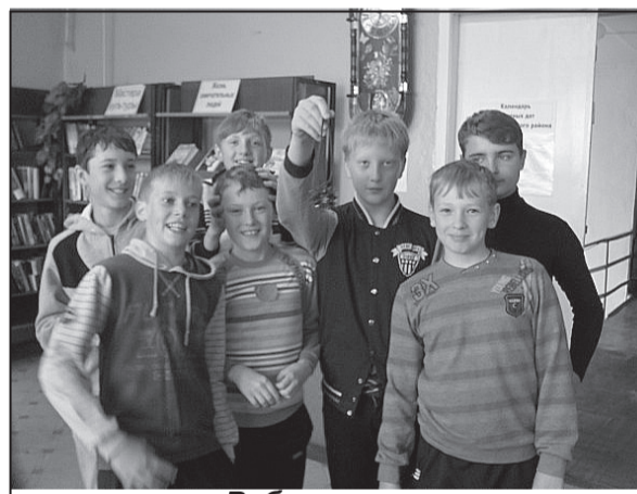
Ребята остались довольны.

А еще запомнилась игра, которую мы проводили, вдохновленные рассказами о пиратах, поисках кладов и удивительных приключениях. Детей из летних лагерей мы пригласили в Заречный парк и устроили для них командные соревнования. Каждая команда должна была найти красные кружки, рассыпанные по всему парку, рядом с которыми находились конверты со спрятанными заданиями. И только выполнив их, команда получала кусок карты, по которой они искали клад.