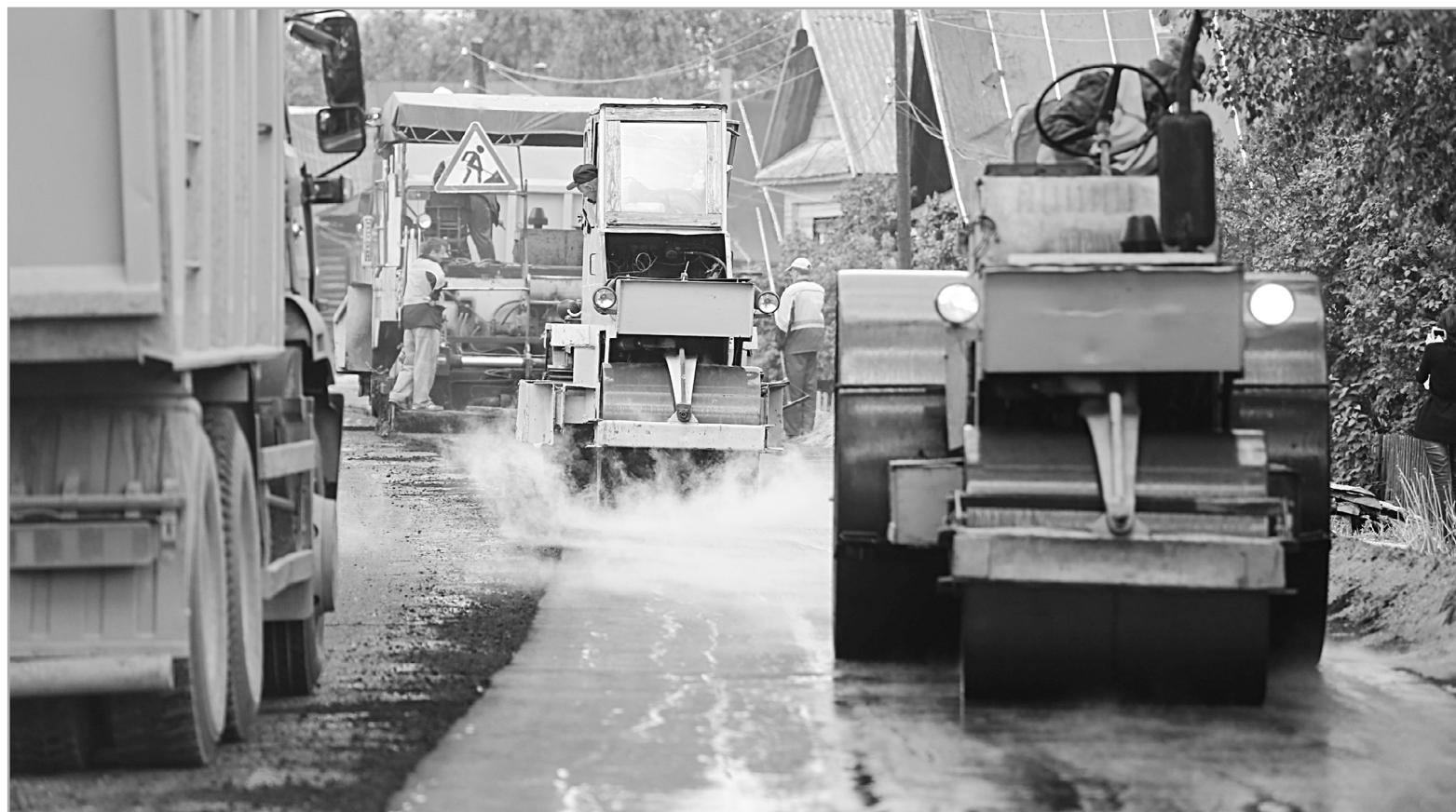
Региональные стандарты качества дорожных работ и контроль их выполнения позволили расторгнуть контракты с недобросовестными подрядчиками и сохранить бюджетные деньги

Ремонт и строительство вели в соответствии с региональными стандартами качества дорожных работ, принятыми в прошлом году. Процесс контролировали представители областного Дорожного фонда. Те участки, качество которых стандартам не соответствовало, в эксплуатацию просто не приняли. Та-