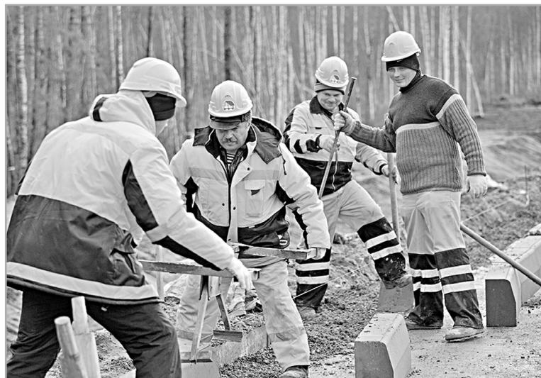
В 2019 году планируется привести в нормативное состояние еще 235 километров автодорог

В этом году общий объем средств Дорожного фонда Тверской области превысил 7,1 млрд рублей. Примерно по 30% из них – почти равными долями – направили на капитальный ремонт и содержание дорог, еще около 12% – на