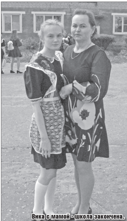
Вика с мамой – школа закончена.

старший воспитатель детского сада № 2 «Солнышко».