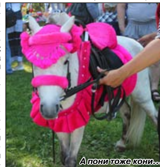
А пони тоже кони...

Вечером праздник продолжился на Советской площади. Здесь собралось много народу. Пришли чтобы послушать концерт Санкт-Петербургской фолк-группы «Ярмарка» (многих заинтри-