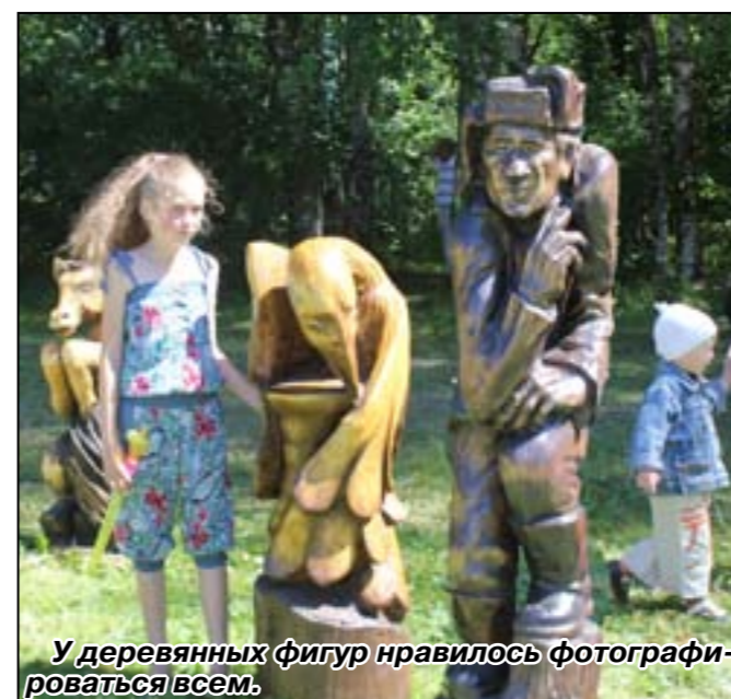
У деревянных фигур нравилось фотографироваться всем.

А вечером на Советской площади впервые состоялись соревнования «Авто Леди». Но об этом читайте в следующем номере.