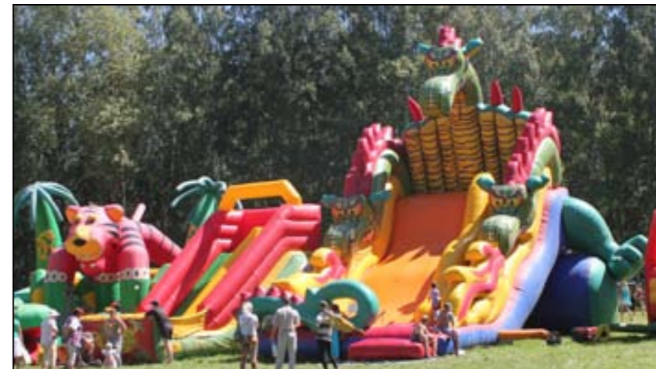
Даже взрослые казались маленькими на фоне огромных батутов.

Наверное, в такие минуты каждый из нас по-особому чувствует,