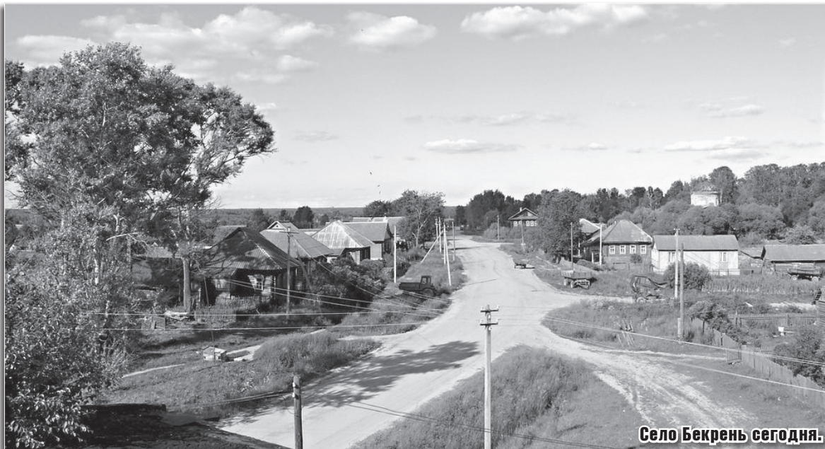
Село Бекрень сегодня.