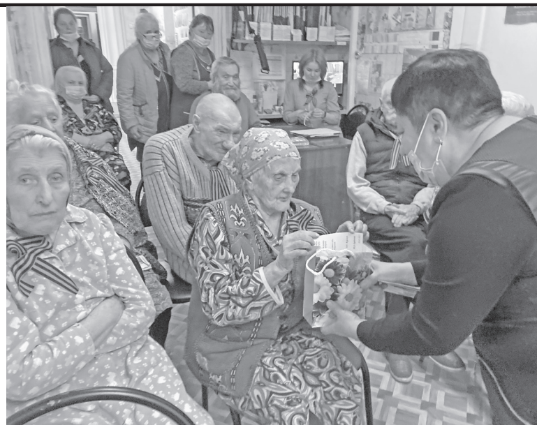
Страницу подготовила Н. КРЫЛОВА, руководитель клуба «Ветеран».

Участники ансамбля «Вдохновение» пели песни Великой Отечественной войны вместе с проживающими в центре.