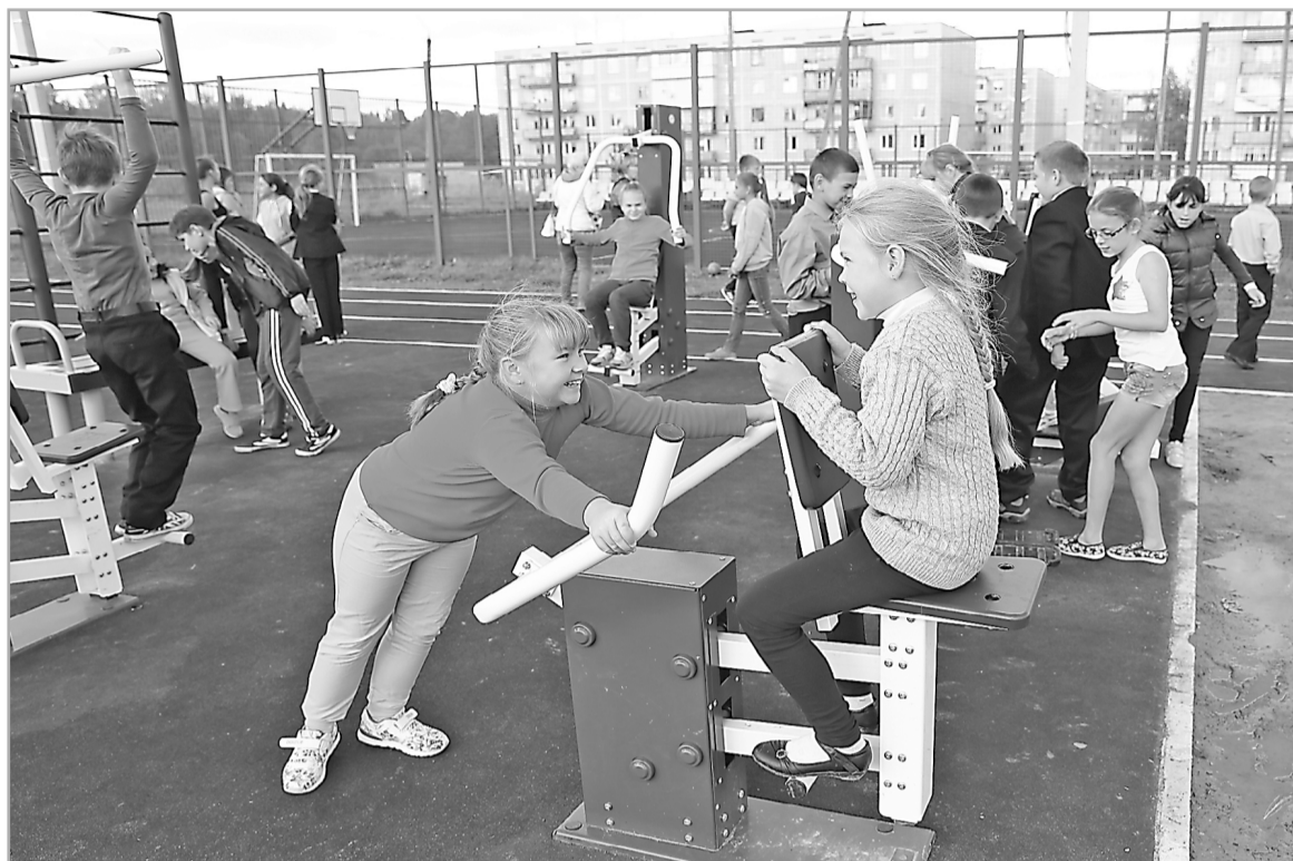
Жители городских и сельских поселений нередко выбирают в качестве приоритетных проектов строительство спортивных и детских игровых площадок, обустройство зон отдыха

Но можно не просто заявлять о проблеме, а решать ее вместе с руководством региона, став членом одной большой команды. По такому принципу действует программа поддержки местных инициатив. Ее суть в том, что жители городских и сельских поселений при значительной финансовой поддержке области сами реализуют наиболее важный для них проект. Это может быть ремонт местной дороги или водопровода, установка уличных тренажеров или, например, обустройство пожарного пруда.