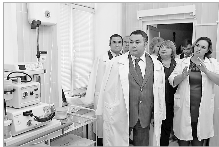
Высокотехнологичная медицинская помощь станет доступнее для жителей Тверской области

Еще одна приятная новость – в Тверскую область в авгу-