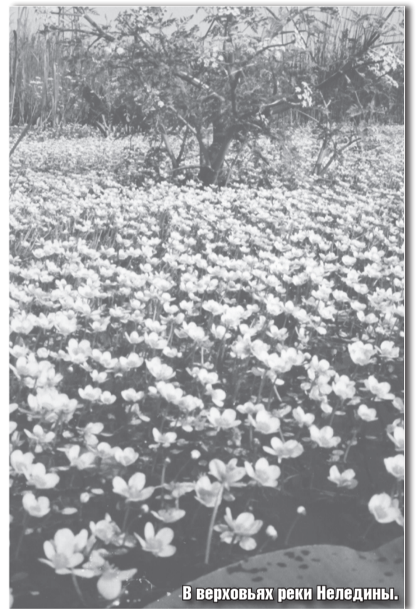
В верховьях реки Неледины.

Природа нашего родного края нуждается в бережном отношении. Для её сохранения требуются огромные усилия, а самое главное – отношение людей. Без