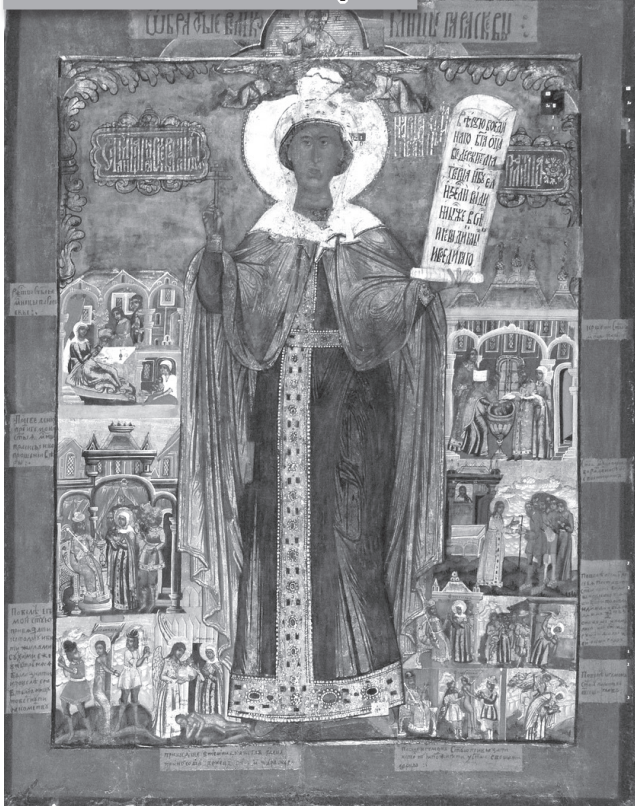
ВЕЛИКОМУЧЕНИЦА ПАРАСКЕВА ПЯТНИЦА

Конец XVII – первая четверть XVIII века. Поволжье. Дерево, темпера, 95,5х75,5 см. Из Богоявленской церкви села Мартыново Краснохолмского района Тверской области. Собрание ЦМиАР.