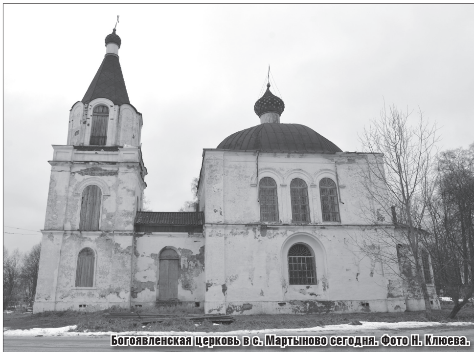
Богоявленская церковь в с. Мартыново сегодня.