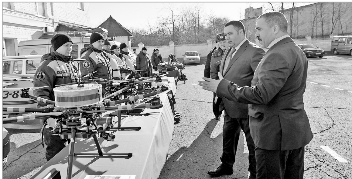
Сотрудники Главного управления МЧС России по Тверской области продемонстрировали технические средства, которые могут быть задействованы в период весеннего половодья

Тверская область готовится к весеннему половодью