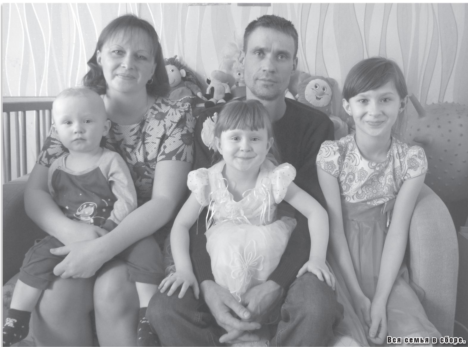
Вся семья в сборе.

группорг организации общества слепых по Краснохолмскому району.