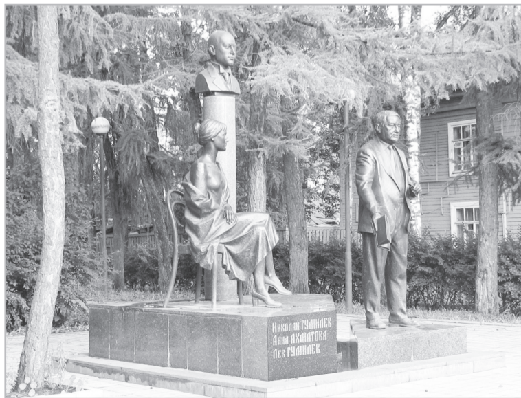
Памятник семье Гумилевых – Ахматовой – одна из достопримечательностей Бежецка

дов нашей страны, реализовать творческий потенциал их жителей. В конкурсе приняли участие 203 города из 65 регионов. Специалисты районной администрации составили паспорт культурной жизни Бежецка, подготовили видео- и фотоматериалы о наиболее значимых событиях в жизни города. В итоге вошли в число победителей. В церемонии награждения принял участие народный артист России Евгений Стеблов.