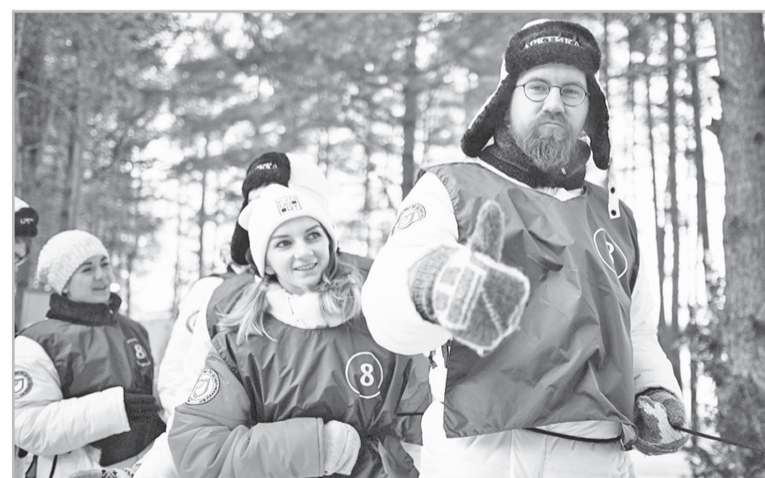
Молодежь готовится покорять Арктику

Молодые ученые обсуждали проблемы и перспективы нефтегазовых разработок в Арктике на дискуссиях с министрами, главами корпораций, профессорами РАН и ректорами ведущих вузов страны, решали реальные задачи по разработке месторождений. Почетными гостями форума, а также руководителями образо-