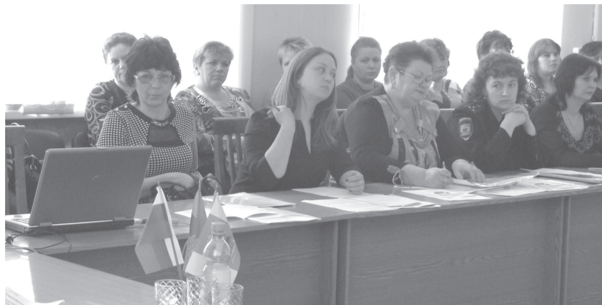
«Защита прав ребенка: профилактика жестокого обращения с детьми». Об этом говорили участники «круглого стола», который состоялся в малом зале администрации района 11 марта.

Шаг 2: руководитель немедленно сообщает о случившемся по телефону 02 - для привлечения к ответственности лиц, допустивших жестокое обращение к ребенку.