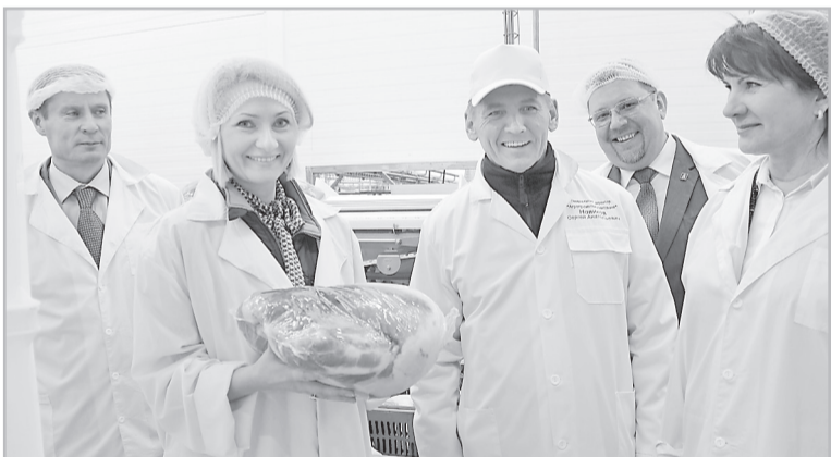
Виктория Абрамченко высоко оценила продукцию агрофирмы «Дмитрова Гора»

Флагман сельского хозяйства региона планирует расширять производственные мощности: в нынешнем году будут открыты новый свинопольный комплекс на 60 тысяч поголовья и молочный комплекс.