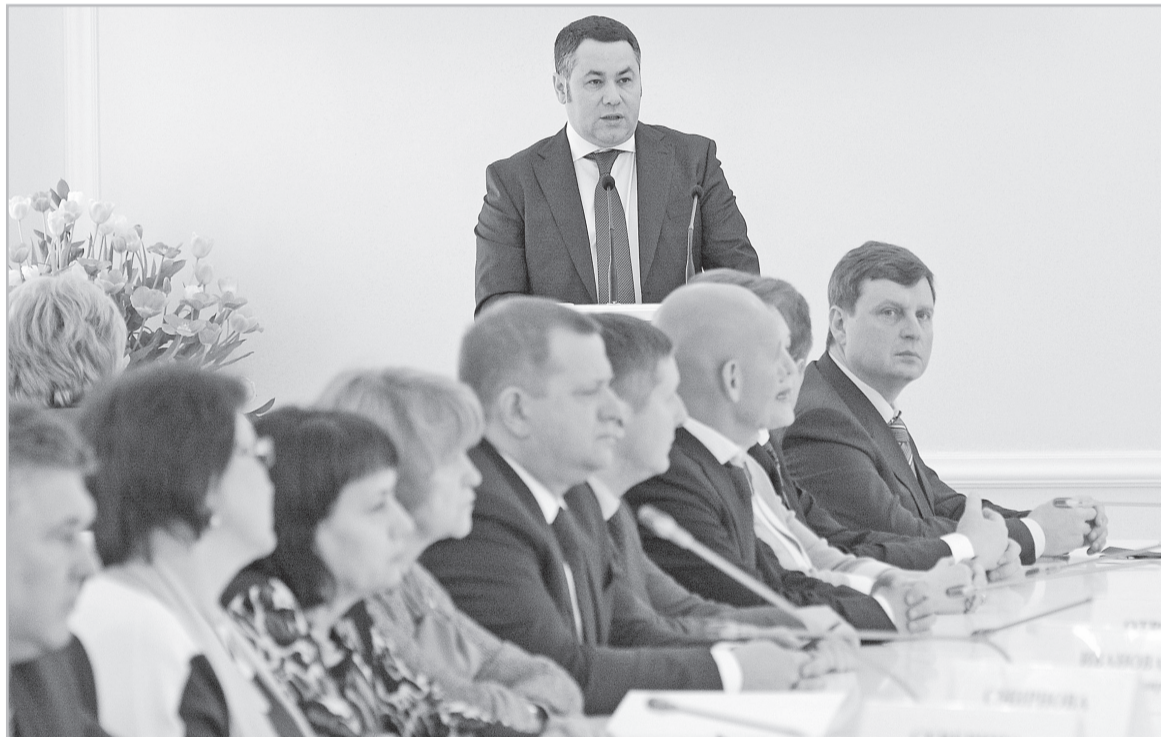
Исполняющий обязанности губернатора Игорь Руденя знакомится с положением дел в регионе

Перемены, которых ждала область, начинаются. Новый исполняющий обязанности губернатора Тверской области Игорь Руденя провел первое заседание регионального Правительства. Определены цели для власти, понятны приоритеты нового главы Верхневолжья