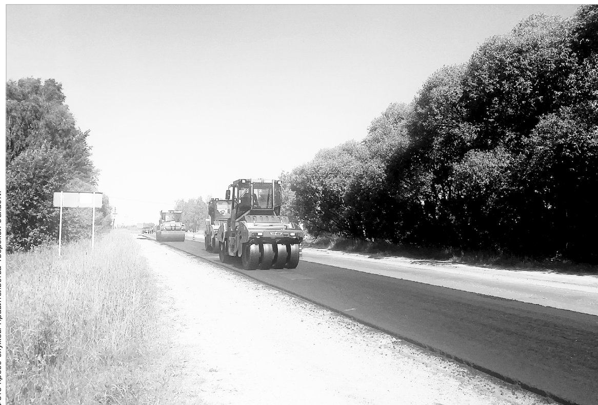
Ремонт автодороги Торжок – Высокое – Берново – Старица

Протяженность участка ремонта 2021 года – 33 км. В настоящее время дорожники фрезеруют су-