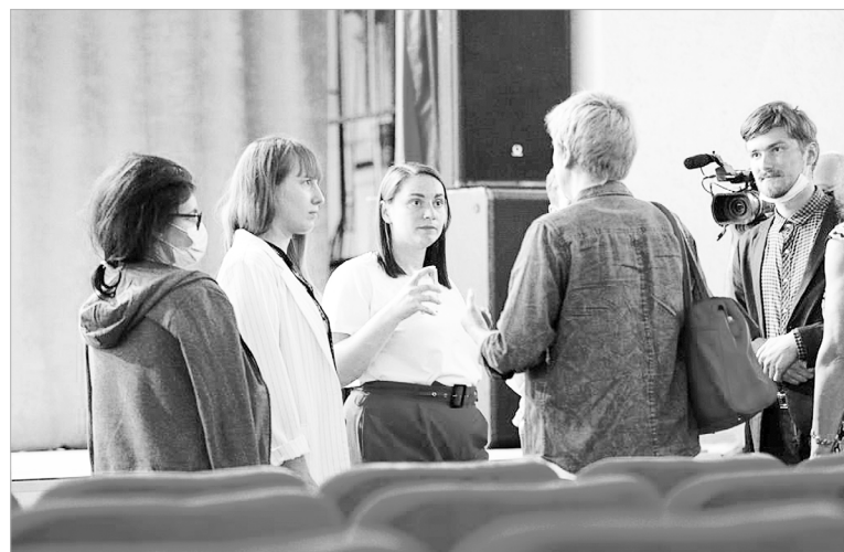
Встреча волонтеров с Юлией Сарановой в Кашине

В Тверской области растут темпы вакцинации от COVID-19. По данным на начало текущей недели, прививку уже сделали более 208 тысяч жителей. Вакцинироваться можно в 56 пунктах. Запись ведется в МФЦ, по телефону 122, на портале gosuslugi.ru, на сайте электронной регистратуры medregtver.ru, по телефонам прививочных пунктов, которые размещены на сайте Министерства здравоохранения Тверской области. Кроме того, вакцинацию на предприятиях и в населенных пунктах области, где нет точек иммунизации, осуществляет 91 выездная бригада.