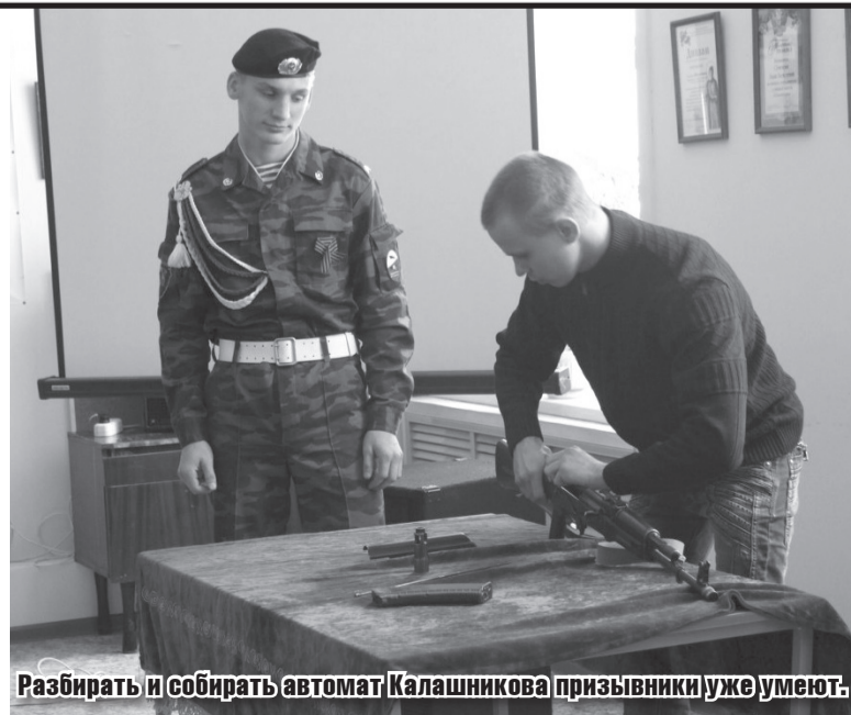
Разбирать и собирать автомат Калашникова призывники уже умеют.