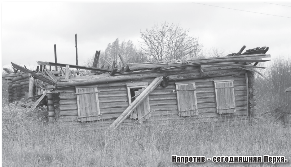
Напротив - сегодняшняя Перха.