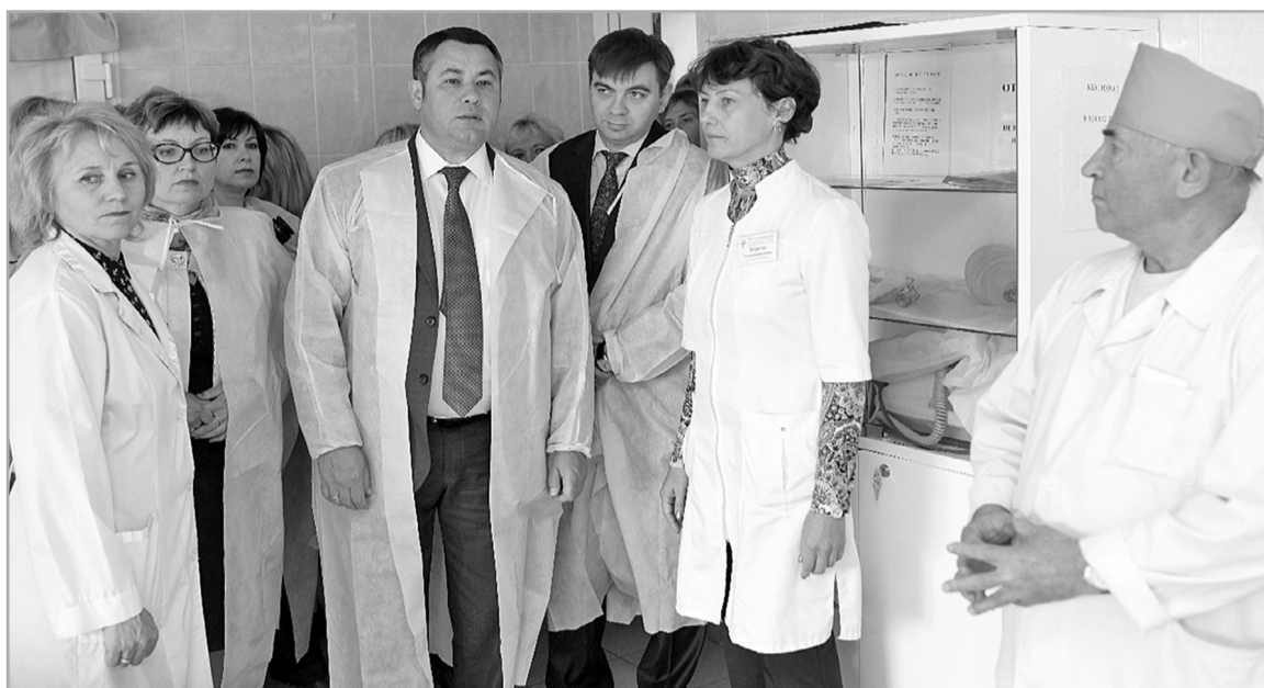
Приводить в порядок учреждения здравоохранения в муниципалитетах Правительство Тверской области намерено поэтапно, в течение следующих двух лет

Также можно составить обращение на сайте минздрав.тверская.область.рф.