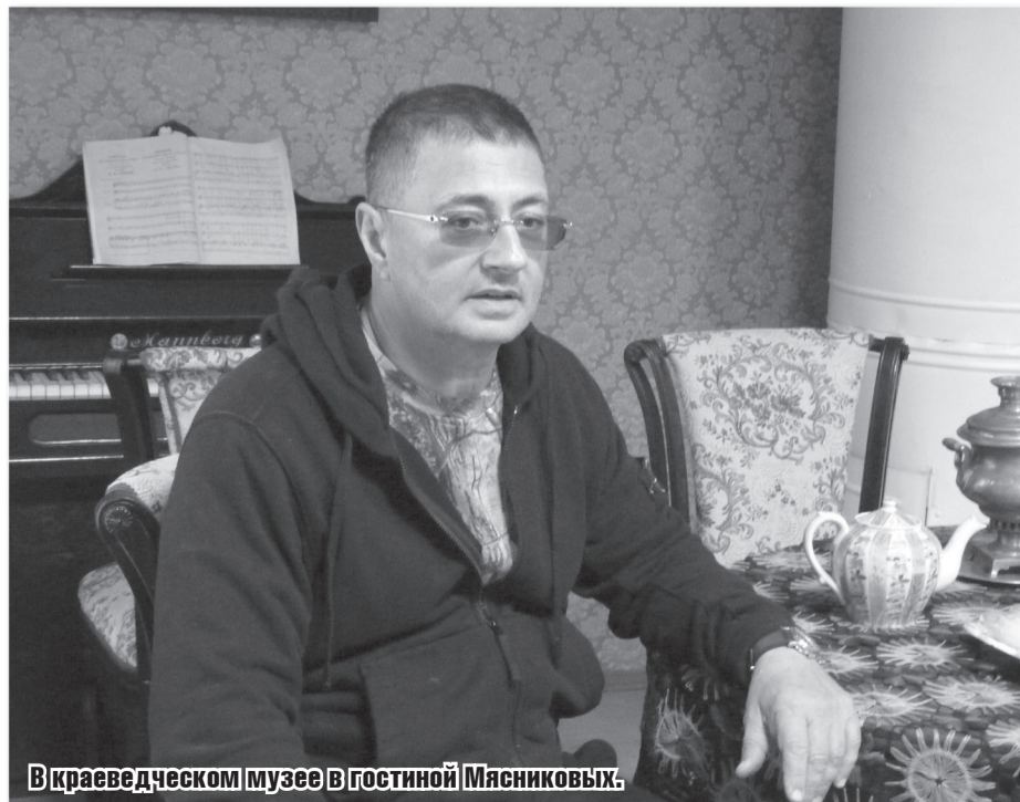
В краеведческом музее в гостинной Мясниковых.

С 2010 года по настоящее время Мясников – главный врач Московской городской клинической больницы № 71. Член Общественной палаты г. Москвы. С 2013 года он ведущий программы «О самом главном с доктором Мясниковым» на телеканале «Россия 1».