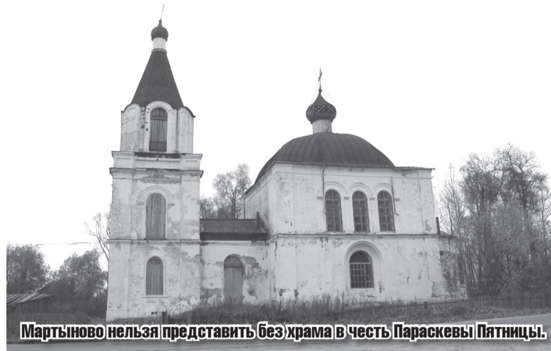
Мартыново нельзя представить без храма в честь Параскевы Пятницы.

В последнее время наблюдается такая тенденция – жители мегаполисов стараются на отдых приезжать в отдаленные места. Для них несколько сотен километров – не преграда. Покупают пустующие дома и живут летом в деревне целыми семьями. Их не страшит даже то, что этот дом единственный в деревне. Другие – разва-