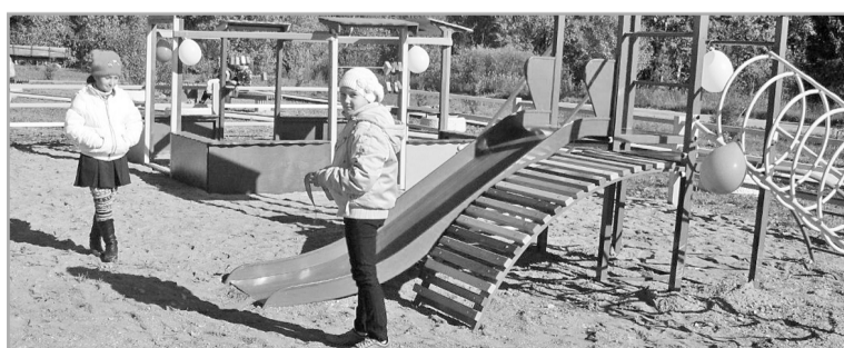
Жители муниципальных образований сами выбирают, с каким объектом вступить в ППМИ, контролируют ход реализации проекта и вносят в него свой вклад

Напомним, за 4 года реализации ППМИ на территории региона построено и отремонтировано 525 социально важных объектов общественной