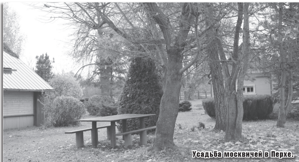
Усадьба москвичей в Перхе.