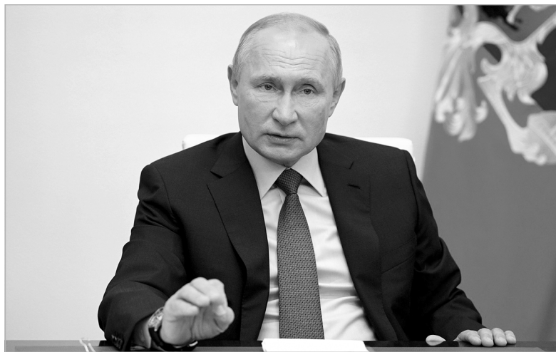
Владимир Путин в Ново-Огарево во время видеоконференции заседания Совета по стратегическому развитию и нацпроектам

Владимир Путин 13 июля провел в режиме видеоконференции заседание Совета по стратегическому развитию и национальным проектам. В ходе обсуждений было принято революционное решение о принятии плана развития страны вплоть до 2030 года. Для этого было предложено скорректировать национальные проекты в соответствии с новыми целями в трехмесячный срок и синхронизировать их с общенациональным антикризисным планом.