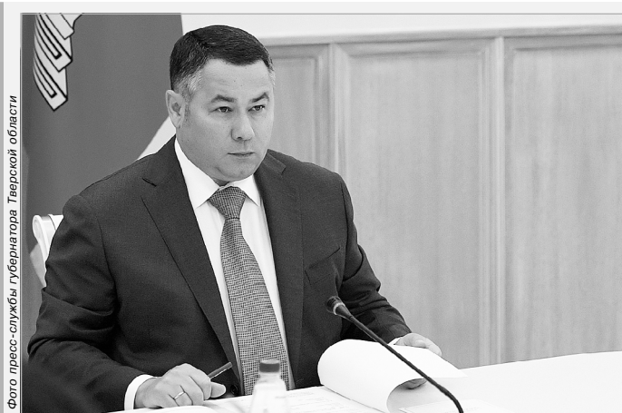
Игорь Руденя во время совещания с членами Правительства Тверской области

«Если многие страны закрыты до сих пор, нам нужно развивать внутренний туризм, это очевидные вещи, – обратил внимание Путин. – Но инфраструктуру нужно развивать. Без этого что такое внутренний туризм?»