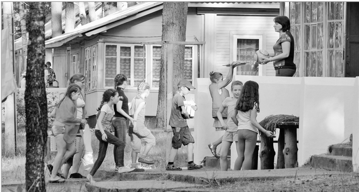
Тематические смены в летних лагерях обеспечивают детям не только оздоровление, но и возможность проявить свои способности

В Верхневолжье готовятся организовать содержательный досуг и оздоровление детей в период школьных каникул