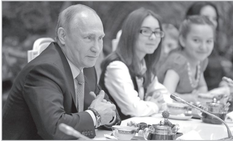
Президент Владимир Путин объявил о перезагрузке демографической политики России

Все, кого непосредственно коснутся внесенные главой государства предложения (а это множество семей), восприняли их с оптимизмом. Потому что это не декларативные заявления, а конкретные, материально подкрепленные шаги. С них и начнется в 2018 году Десятилетие детства, объявленное в России. Мамы смогут спокойно находиться в отпуске по уходу за первенцем, получая увеличенное пособие. А потом устроить своего малыша в ясли, мест в которых станет значительно больше. И водить в детскую