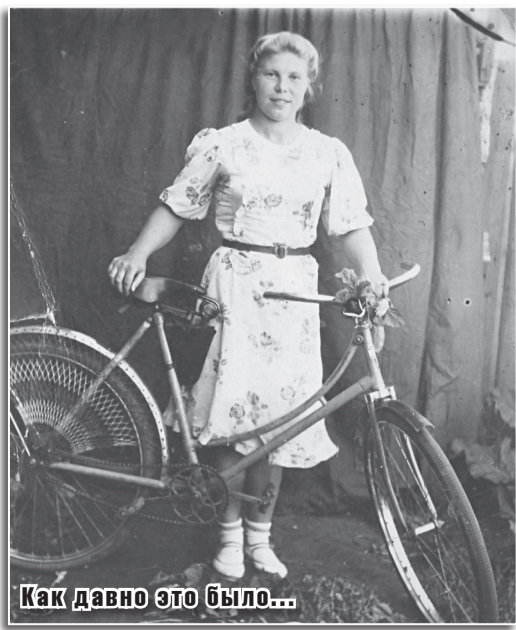
Как давно это было...