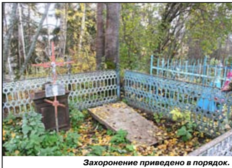
Захоронение приведено в порядок.