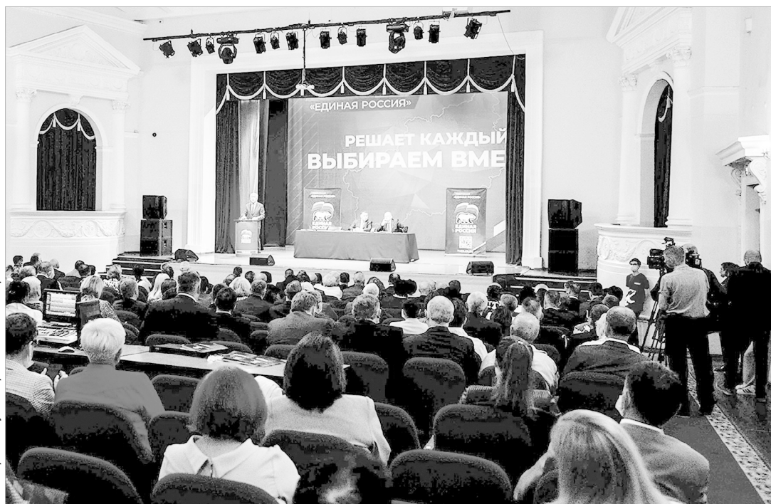
На партийную конференцию «Единой России» в Твери со всего региона прибыли более 280 человек

«В ходе встреч с избирателями прошу каждого депутата провести обсуждение актуальных задач развития территорий, собрать предложения и