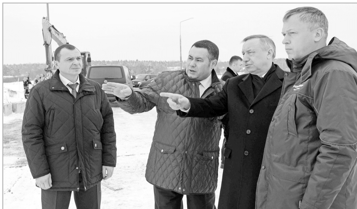
Игорь Руденя и Александр Беглов убедились, что строительство развязки на федеральной трассе М-10 на въезде в Тверь удастся завершить даже раньше установленного срока

со стороны Санкт-Петербурга. Там идет строительство транспортной развязки, которое намерены завершить раньше установленных сроков. В том, что строительство идет хорошими темпами, глава региона и полномочный представитель Президента в ЦФО убедились в ходе посещения объекта.