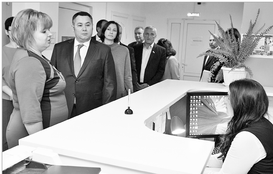
Министерство экономического развития РФ оценило степень эффективности МФЦ на территории нашего региона, как высокую

МФЦ работают по принципу «одного окна» и предоставляют 267 услуг. При этом у граждан отпадает необходимость общаться непосредственно с чиновниками, что, по мнению создателей системы, минимизирует возможную коррупционную составляющую. Чаще всего люди приходят сюда, чтобы поставить на кадастровый учет земельные участки и объекты недвижимости, зарегистрировать право собственности. Это более половины всех обращений. На вто-