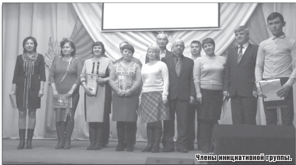
Члены инициативной группы.

В заключение прозвучала песня в исполнении военно-спортивного клуба «Вымпел», посвященная 30-летию легендар-