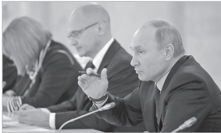
Подпись: Владимир Путин отметил, что повышение позиции России в международном рейтинге деловой активности – очень позитивная тенденция

Безусловно, важно понимать, что творится в мире, как наша страна реагирует на международные угрозы и как страны Запада реагируют на президента Владимира Путина, давно признанного мировым лидером, с которым невозможно не считаться. На Россию пытаются оказать давление санкциями, не однажды забугорные деятели прощупывали возможность разыграть у нас «оранжевую» революцию по грузинскому или украинскому сценарию. Но последовательная, твердая, а местами и жесткая политика, которую проводит наш прези-