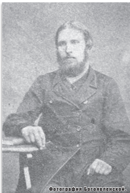
С. Г. Журавлёв.