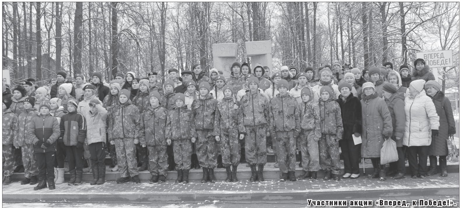
Участники акции «Вперед, к Победе!».