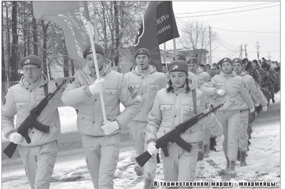
В торжественном марше - юнармейцы.

марша. В марше участвует 75 молодых людей, это равное число юбилейной даты со дня Победы в Великой Отечественной войне. В тор-