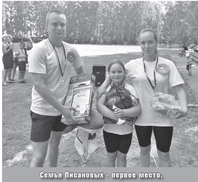
Семья Писановых - первое место.