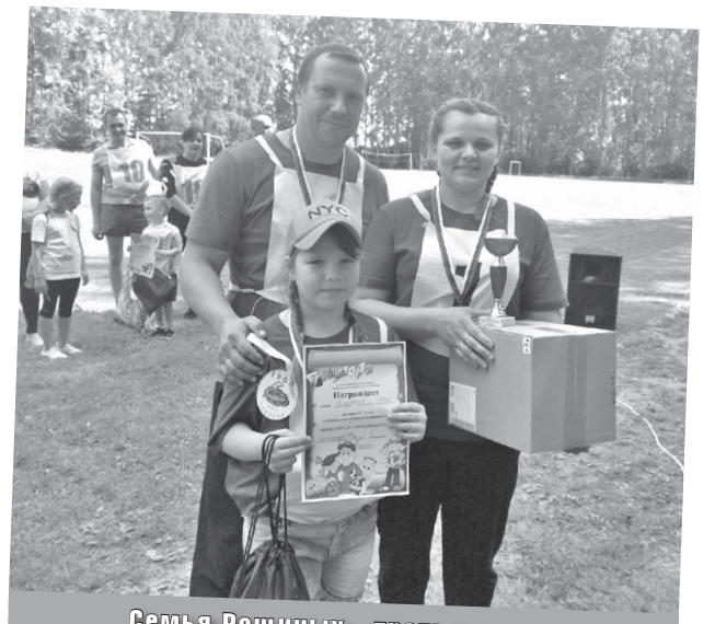
Семья Рожиных - третье место.