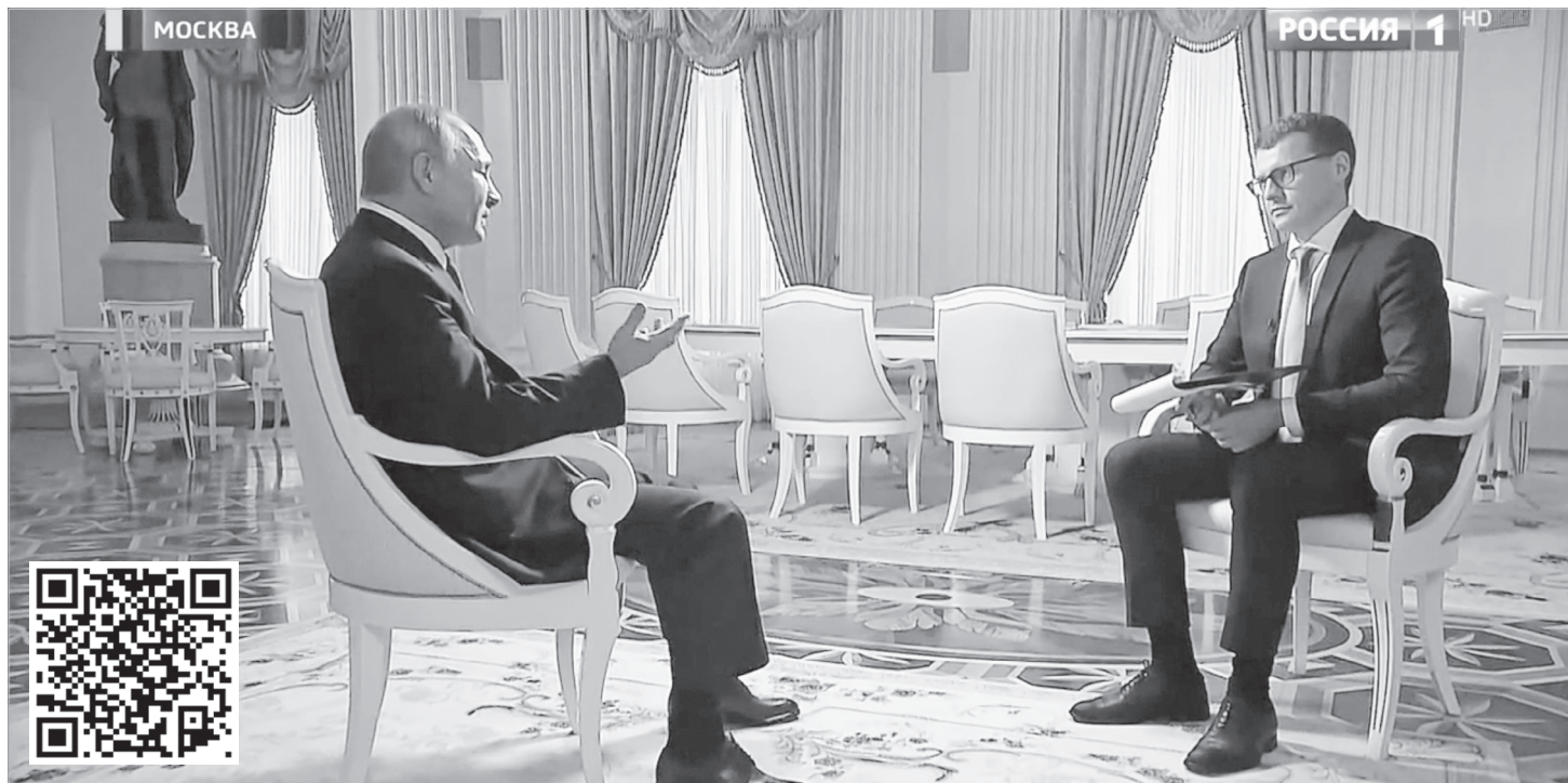
Кадр из телеэфира 5 июля 2020 года телеканала «Россия 1»

Москва. Кремль. Путин. Эфир от 5 июля 2020 года. Редчайшая возможность увидеть, как происходит запись обращения Владимира Путина к россиянам – по ссылке в QR-коде