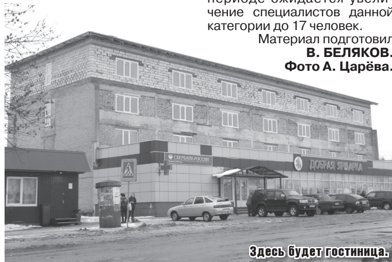
Здесь будет гостиница.