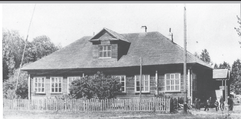
Рачевская старая школа - бывшее земское училище им. Кисловского.