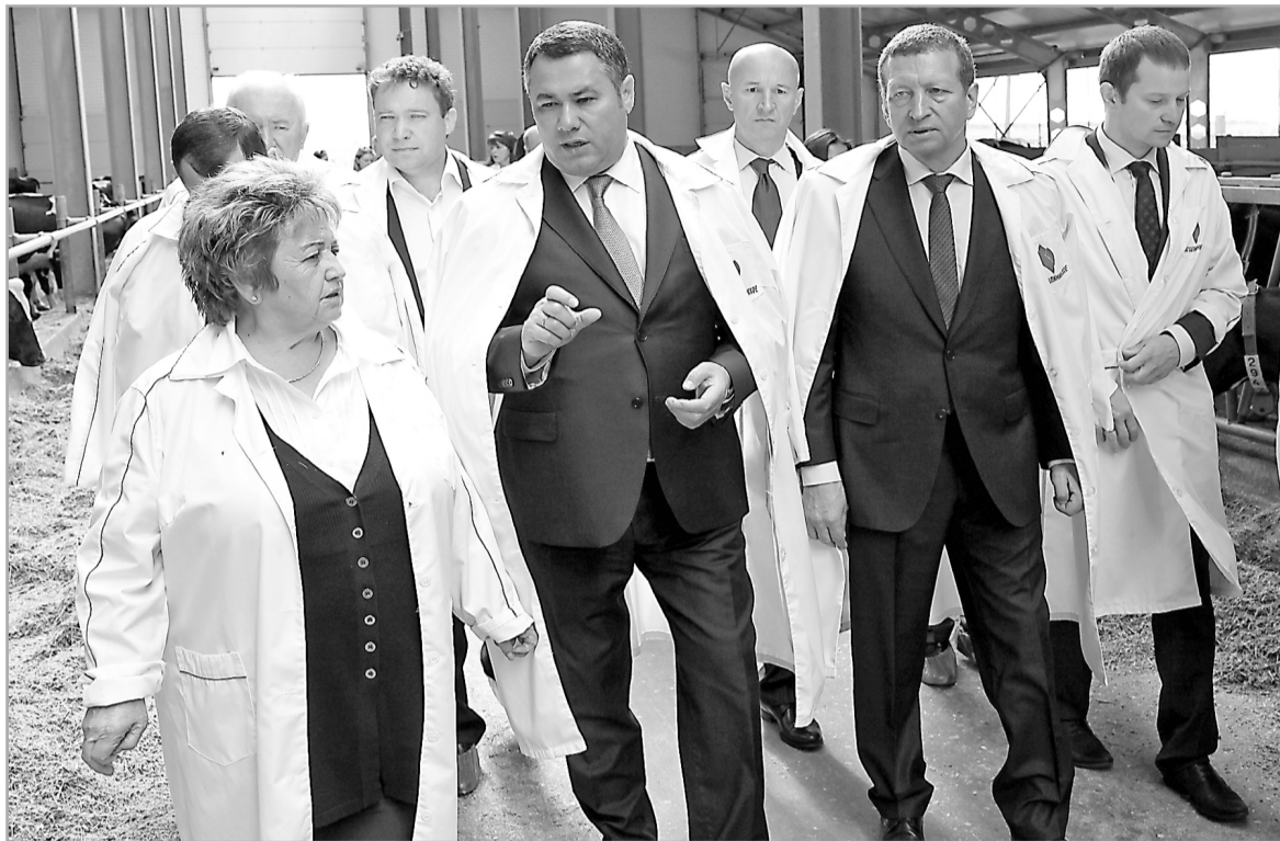
Более 20 млрд руб. вложат в сельское хозяйство Тверской области инвесторы

В агропромышленном комплексе региона наметилась положительная динамика