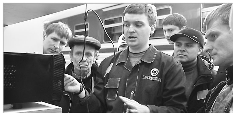
Количество мигрантов сократилось на 23%, что позволило обеспечить 3 тысячи рабочих мест для жителей Верхневолжья

За 8 месяцев текущего года количество трудовых мигрантов в нашей области сократилось на 23%, что позволило обеспечить 3 тысячи рабочих мест для жителей Верхневолжья. Благодаря последовательной политике в этой