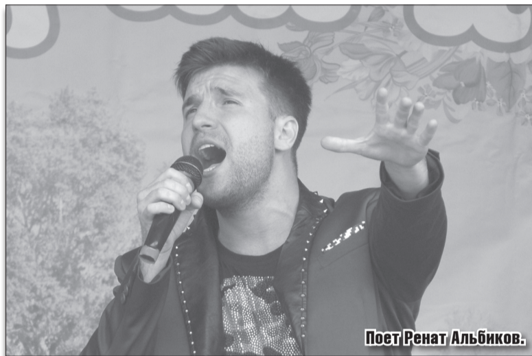
Поэт Ренат Альбиков.