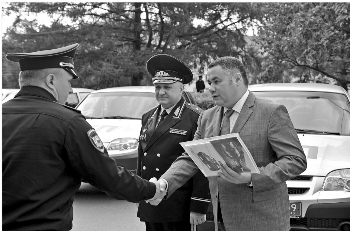
В 2017 году на приобретение патрульных машин выделено более 8,6 млн рублей

Полиция должна быть оперативной и мобильной – это прописная истина. А для Верхневолжья, с нашими огромными расстояниями между городами, деревнями, селами, это еще и серьезная задача. Правительство региона вместе с УМВД по Тверской области продолжают укреплять материально-техническую базу правоохранителей. В 2017 году на приобретение патрульных машин выделено более 8,6 млн рублей. Чуть раньше, в мае, было передано еще 27 автомобилей батальонам ДПС, работающим на федеральных трассах, и отделам ГИБДД из семи районов области, а также закуплено более 50 видеорегистраторов для патрульных машин,