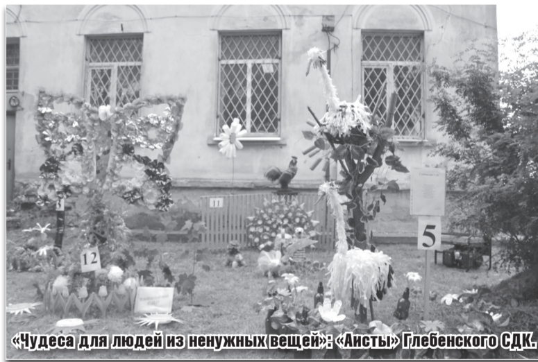
«Чудеса для людей из ненужных вещей»: «Аисты» Глебенского СДК.