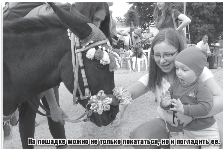
На лошадке можно не только покататься, но и погладить ее.