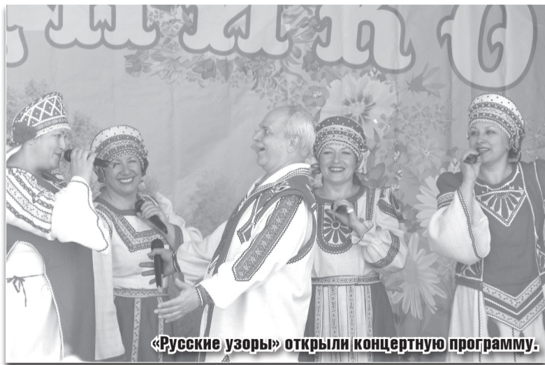
«Русские узоры» открыли концертную программу.