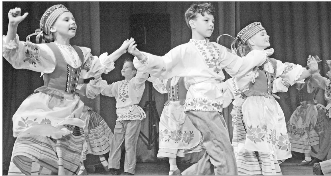
Охват детей дополнительным образованием в сфере культуры в Тверской области выше, чем в среднем по ЦФО, и составляет 14,2 процента

– Президент России Владимир Путин в послании Федеральному Собранию назвал формирование целостной системы поддержки творческих способностей детей мощным ресурсом развития нашей страны,