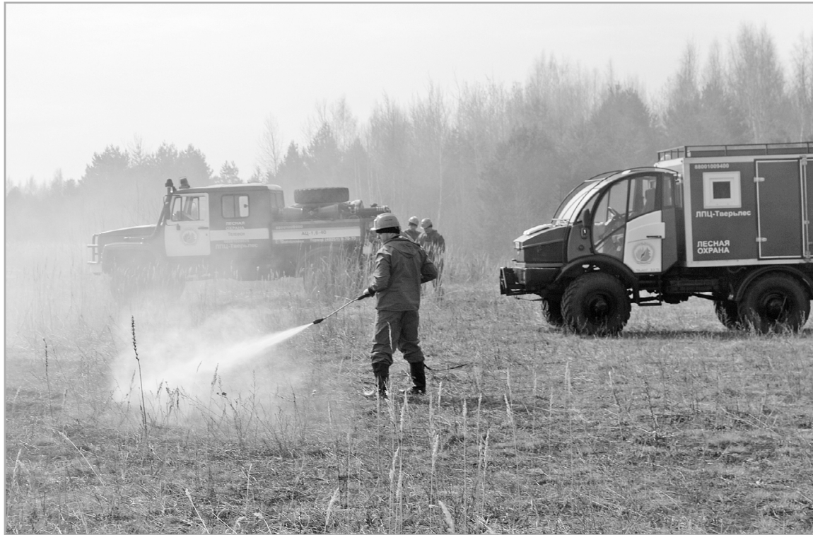
В регионе к борьбе с огнем готова хорошо оснащенная группировка противопожарных сил и средств

В прошлом году впервые за долгое время торфяных пожаров удалось избежать. А вот лес