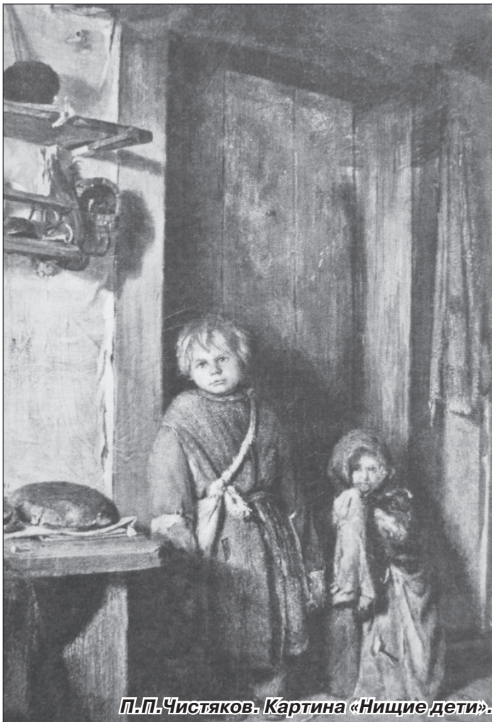
П. П. Чистяков. Картина «Нищие дети».

Подготовила помощник врача эпидемиолога филиала ФБУЗ «ЦГ и Э в Тверской области» в Бежецком районе И. АЛЕКСЕЕВА.