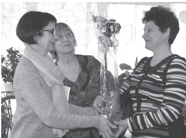
Поздравление от коллег из областной библиотеки им. Горького.

клуб садоводов-любителей «Хлопотушки», театральная студия «Фантазеры».