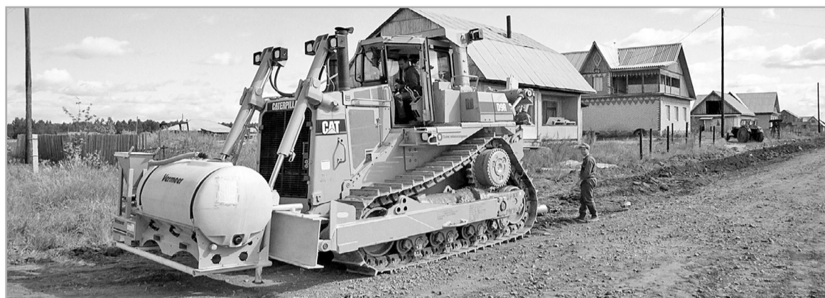
До конца 2017 года в тринадцати муниципалитетах будут построены новые объекты газоснабжения

Из 25 заявок, представленных муниципалитетами на конкурс по распределению субсидий, одобрены 24. Это объекты