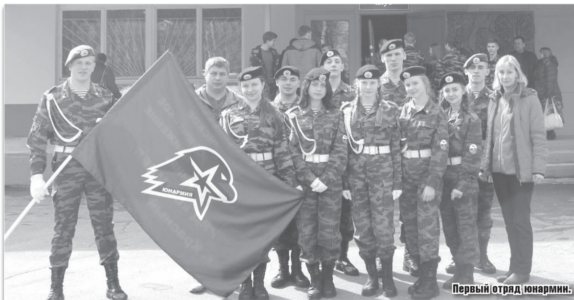
Первый отряд юнармии.

И вот последняя страничка. Она о трудных – нетрудных подростках. Собираю ходатайства на награждение на День молодёжи. И вдруг среди характеристик одна очень положительная на бывшего трудного подростка. Что же это? Может ошибка? Нет, руководитель предприятия подтверждает,