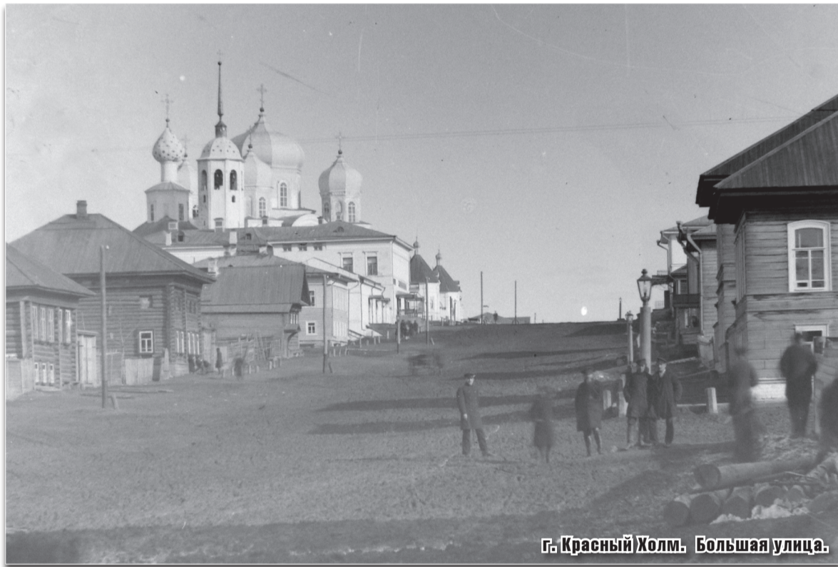
г. Красный Холм. Большая улица.

5-й съезд Советов образовал новый состав уездного исполнительного комитета из 20 человек, в том числе 16 большевиков, 2 сочувствующих и 2 левых эсеров. На том же съезде получили но-