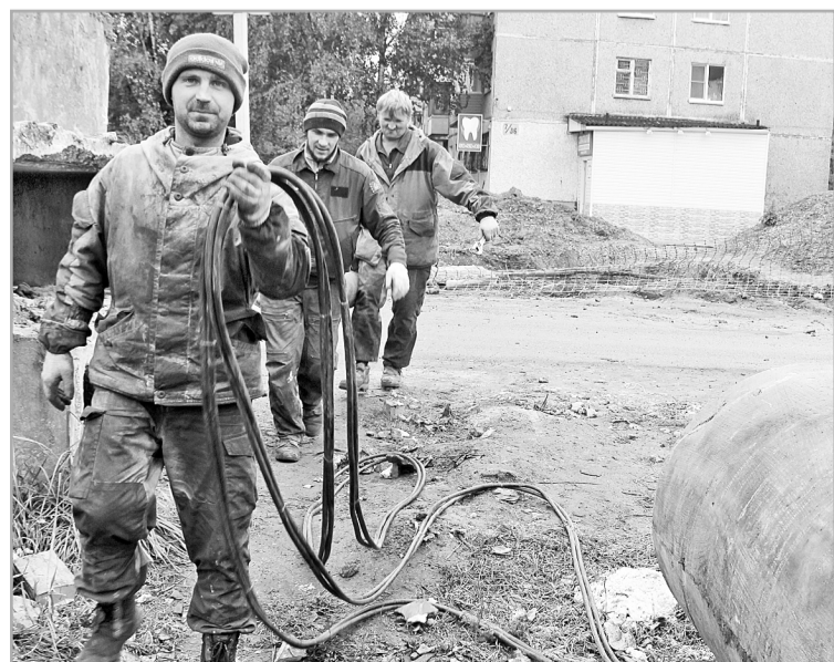
В 15 муниципалитетах провели капремонт 25 объектов ЖКХ

– Хочется поблагодарить Правительство Тверской области за возобновление программы модернизации, которая позволила усовершенствовать котельные во многих районах. Проводится большая работа по капремонту сетей, что позволяет не только своевременно входить в отопительный сезон, но и проходить его стабильно.