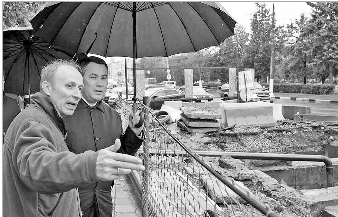
Подготовка к осенне-зимнему периоду началась еще весной и по-прежнему остается в центре внимания регионального правительства и глав муниципалитетов

Тверская область планомерно входит в отопительный сезон