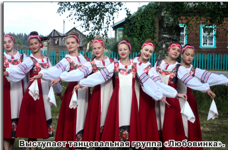
Выступает танцевальная группа «Любовинка».