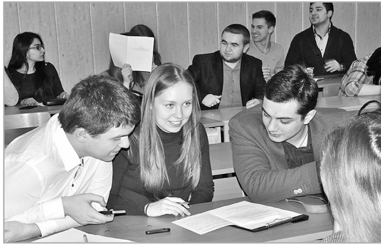
Повышение престижа тверских вузов уменьшит отток выпускников школ в другие регионы

Расчет на то, что вчерашний студент за четыре года создаст семью, обзаведется детьми и лучшей доли искать в другой регион не поедет. Так ли? Ответом может прозвучать предостережение, озвученное однажды Президентом России Владимиром Путиным как раз