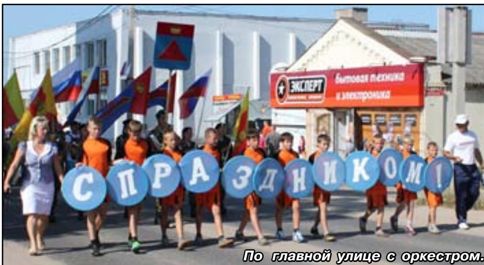
По главной улице с оркестром.

Колонна шествовала на стадион, где уже полным ходом шла торговля различными яствами. Их представители Максатихинское горпо, Сонковское и Весьегонское райпо, горпо «Краснохолмский пищекомбинат», ПО «Мастер». Сельские поселения тоже предоставили свои товары. Их места были красиво украшены. Можно было поучаствовать в мастер-классе, купить изделия, созданные краснохолмскими умельцами.