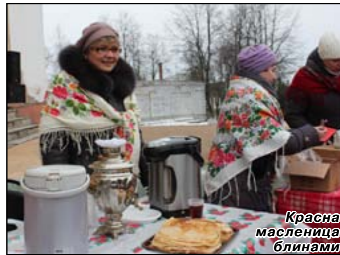
Красна масленица блинами

неделя, когда каждый день несет свое название и значение. Первый день – встреча, второй – заигрыш (в этот день в игры играли), третий – лакомка, четвертый – разгуляй, пятый и шестой – тещины вечерки (отсюда и пошло «к теще на блины») и золовкины посиделки, последний день – прощенное воскресенье. К середине гулянья «А мы масленицу провожаем» народу собралось на площади уже порядочно. Наверное услышали звуки музыки. Со сцены слух краснохолм-