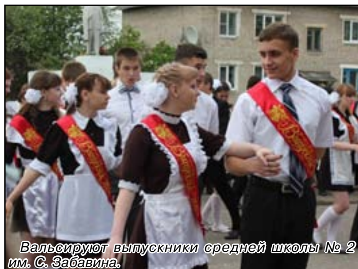
Вальсируют выпускники средней школы № 2 им. С. Забавина.