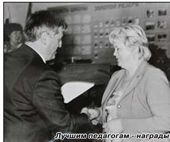
Лучшим педагогам - награды.

В 2014 году предполагается открыть детский сад на базе социально-реабилитационного центра. Это позволит ликвидировать оче-