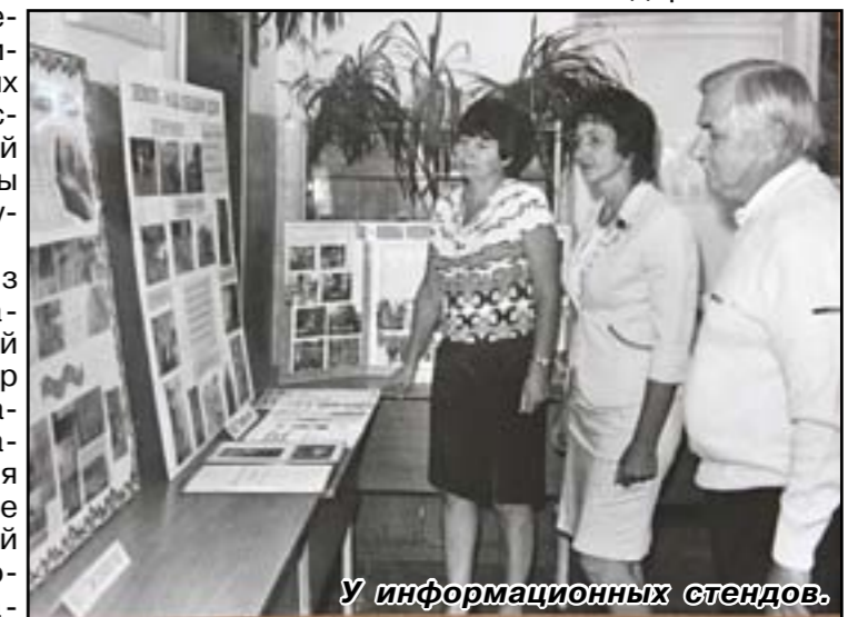
У информационных стендов.

Важнейшим звеном модернизации системы образования является педагог.