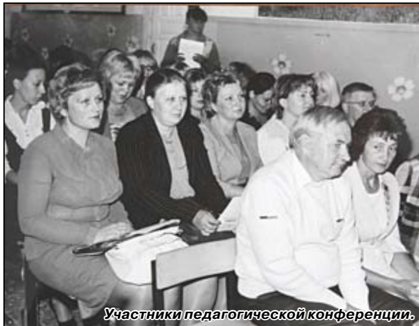
Участники педагогической конференции.

С целью накопления и распространения опыта по введению и реализации федерального государственного образовательного стандарта на базе Краснохолмской средней школы № 2 им. С. Забавина продолжает работу пилотная площадка по опережающему введению ФГОС.