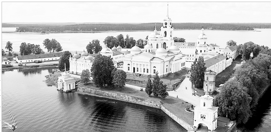
Проект туристско-рекреационного кластера «Селигерия» заявлен на всероссийский конкурс в числе 115 других. В финал выйдут 30 участников, получивших наибольшую народную поддержку и одобрение конкурсной комиссии. Проголосовать за Тверскую область можно на сайте https://priroda.life/ до 23 июля

Всего по завершению текущего дорожного сезона по национальному проекту в Тверской области должно быть введено в эксплуатацию 153,6 км. Это участки семи автодорог опорной дорожной сети региона: Тверь – Рождествено – 1-е Мая – Ильинское, Тверь – Бежецк –