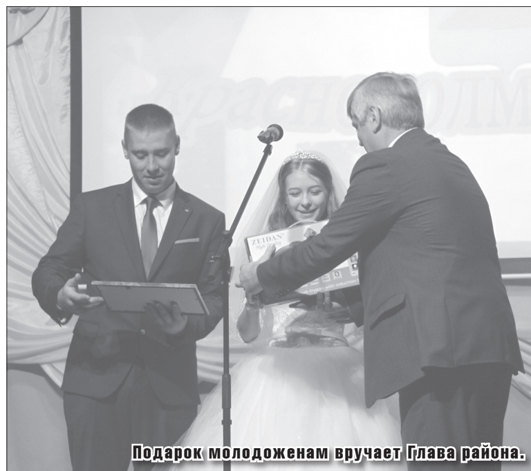
Подарок молодоженам вручает Глава района.