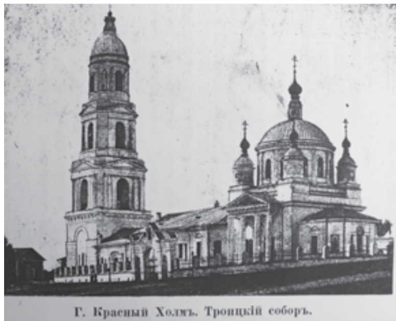
г. Красный Холм. Троицкий собор.

Виктор Александрович рассказывал, что радость