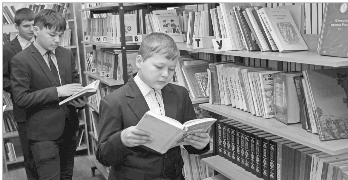
Многие школы области получают дополнительную поддержку благодаря тому, что новая власть более эффективно считает и использует каждый бюджетный рубль

Игорь Руденя во время поездки по области часто посещает районные школы, другие образовательные учреждения и всегда интересуется, как организован учебный процесс, по каким дорогам везут детей школьные автобусы, комфортно ли ребятам учиться, как и где они сдают ЕГЭ. Этот интерес не праздный. Как известно, именно глава региона теперь возглавляет областную бюджетную комиссию. Игорь Руденя принял такое решение, чтобы, с одной стороны, навести порядок в расходах казны, а с другой – хозяйски сократить бюрократию и ускорить распределение бюджетных средств на те направления, где областные финансы особенно необходимы. И вот благодаря новому подходу, за счет экономии и поступления федеральных трансфертов появилась возможность направить дополнительное финансирование в социальную сферу.