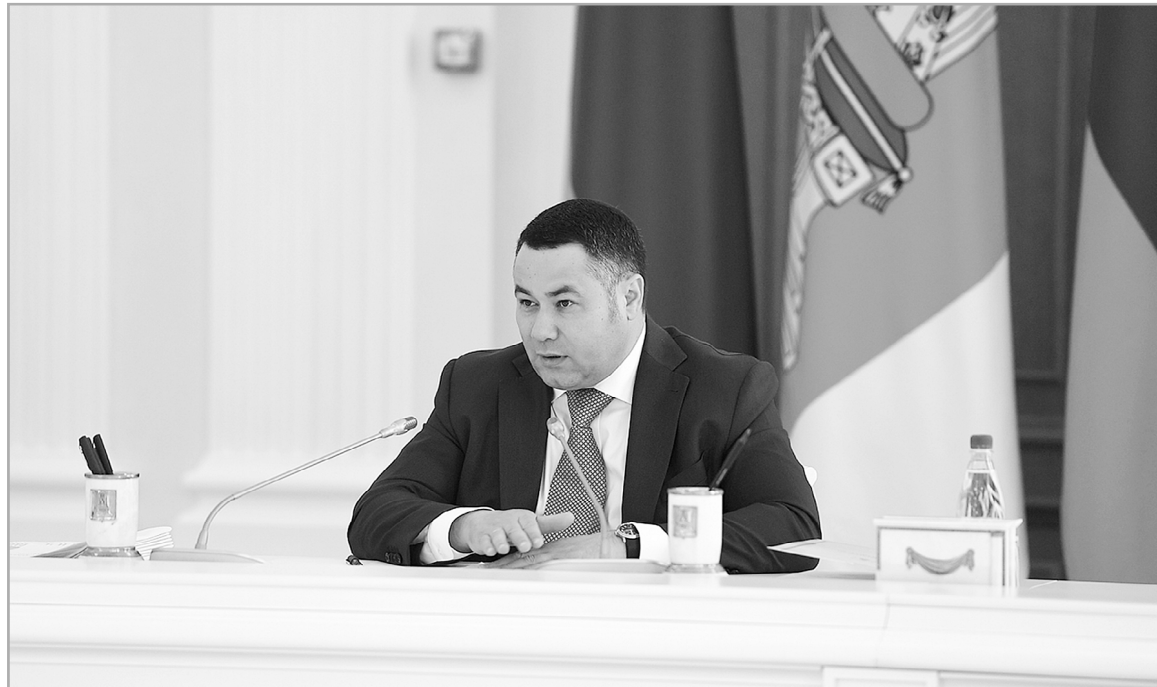
Игорь Руденя: «Для нас является одним из приоритетных направлений улучшение состояния инфраструктуры, развития системы ЖКХ»

Хозяйство это большое: на территории региона более 6 тыс. км водопроводных сетей, свыше 2,5 тыс. км канализационных и почти 2 тыс. км тепловых сетей. Тепловою энергию вырабатывают 800 котельных, 4 ТЭЦ и одна ПК. На подготовку теплосетей к осенне-зимнему периоду 2017–2018 годов было направлено более 315 млн рублей. На эти деньги удалось отремонтировать или модернизировать 102 котельные, заменить или отремонтировать более 21 км теплосетей. Еще почти 64 млн рублей вложено в подготовку