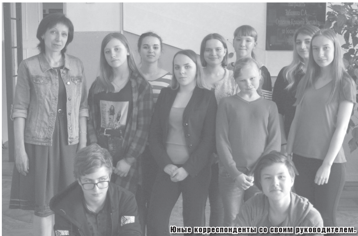
Юные корреспонденты со своим руководителем.

4 июня нашей газете «Сельская новь» исполнится 100 лет. Это большой юбилей! Помимо статей сотрудников газеты, которые посвятили свою жизнь журналистике, на ее страницах также можно встретить заметки и новости совсем еще юных корреспондентов. Это ребята из объединения юных журналистов «Новое течение». Они уже много лет сотрудничают с газетой.