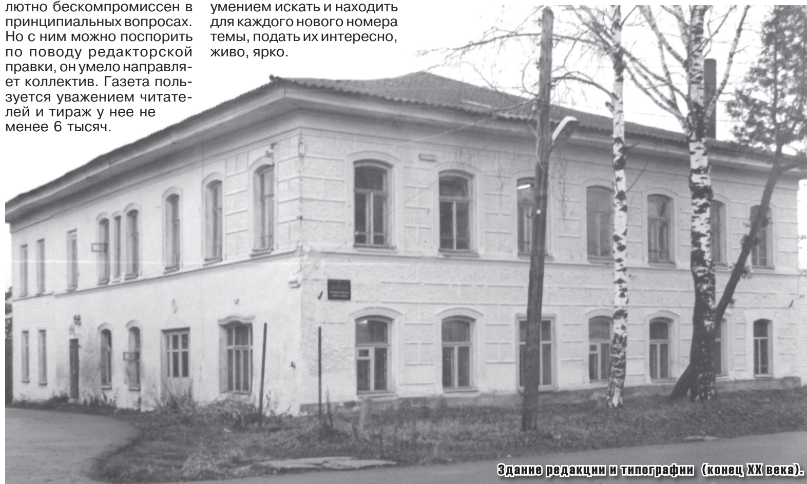
Здание редакции и типографии (конец XX века).