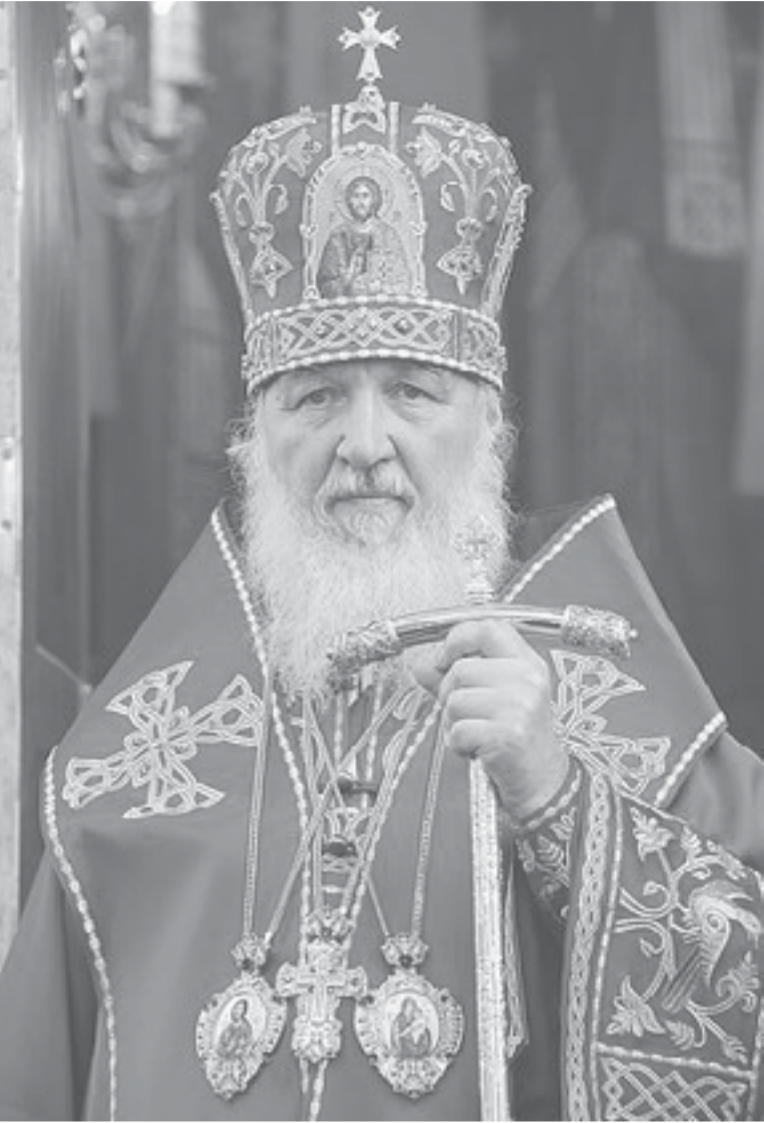
Преосвященные архипастыри, всечестные пресвитеры и диаконы, боголюбивые иноки и инокини, дорогие братья и сестры! ХРИСТОС ВОСКРЕСЕ!

Патриарха Московского и всея Руси Кирилла архипастырям, пастырям, диаконам, монашествующим и всем верным чадам Русской Православной Церкви