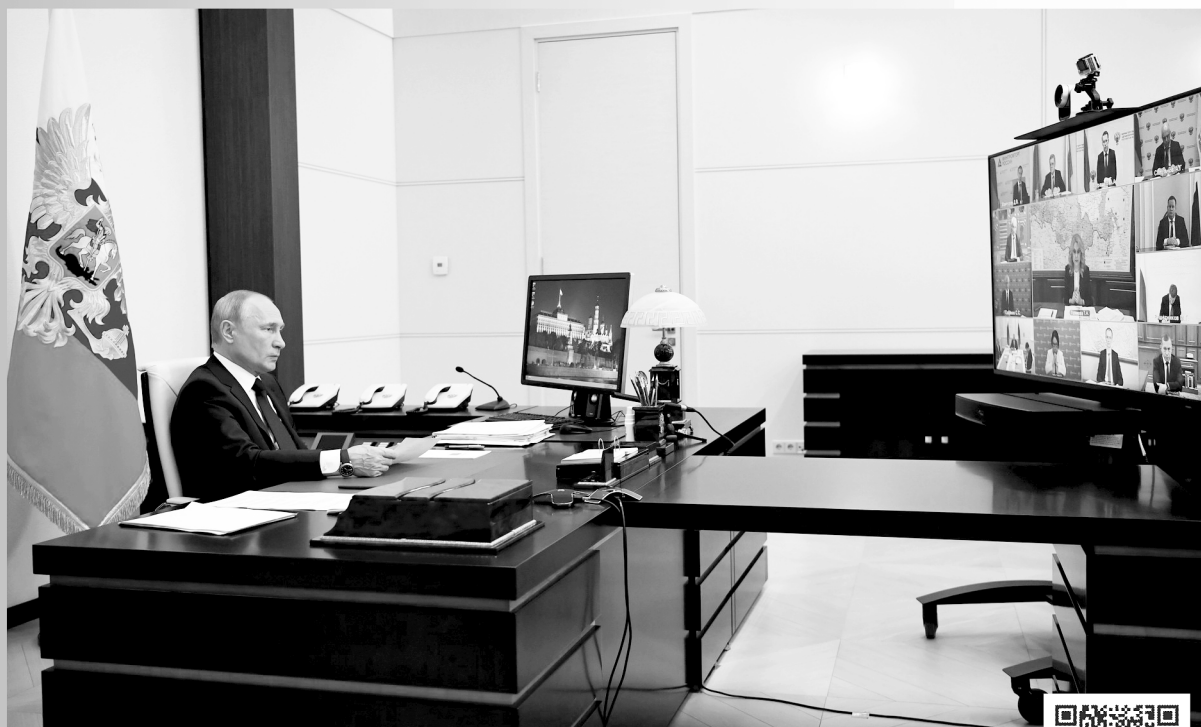
По ссылке в QR-коде – полная видеозапись совещания о санитарно-эпидемиологической обстановке

ПРЕЗИДЕНТ ПРИНЯЛ РЕШЕНИЕ ЗАВЕРШИТЬ ПЕРИОД НЕРАБОЧИХ ДНЕЙ В СТРАНЕ. «С 12 МАЯ ЕДИНЫЙ ПЕРИОД НЕРАБОЧИХ ДНЕЙ ДЛЯ ВСЕХ ОТРАСЛЕЙ ЗАВЕРШАЕТСЯ. НО НЕ ЗАВЕРШАЕТСЯ БОРЬБА С ЭПИДЕМИЕЙ», – СКАЗАЛ ПУТИН.