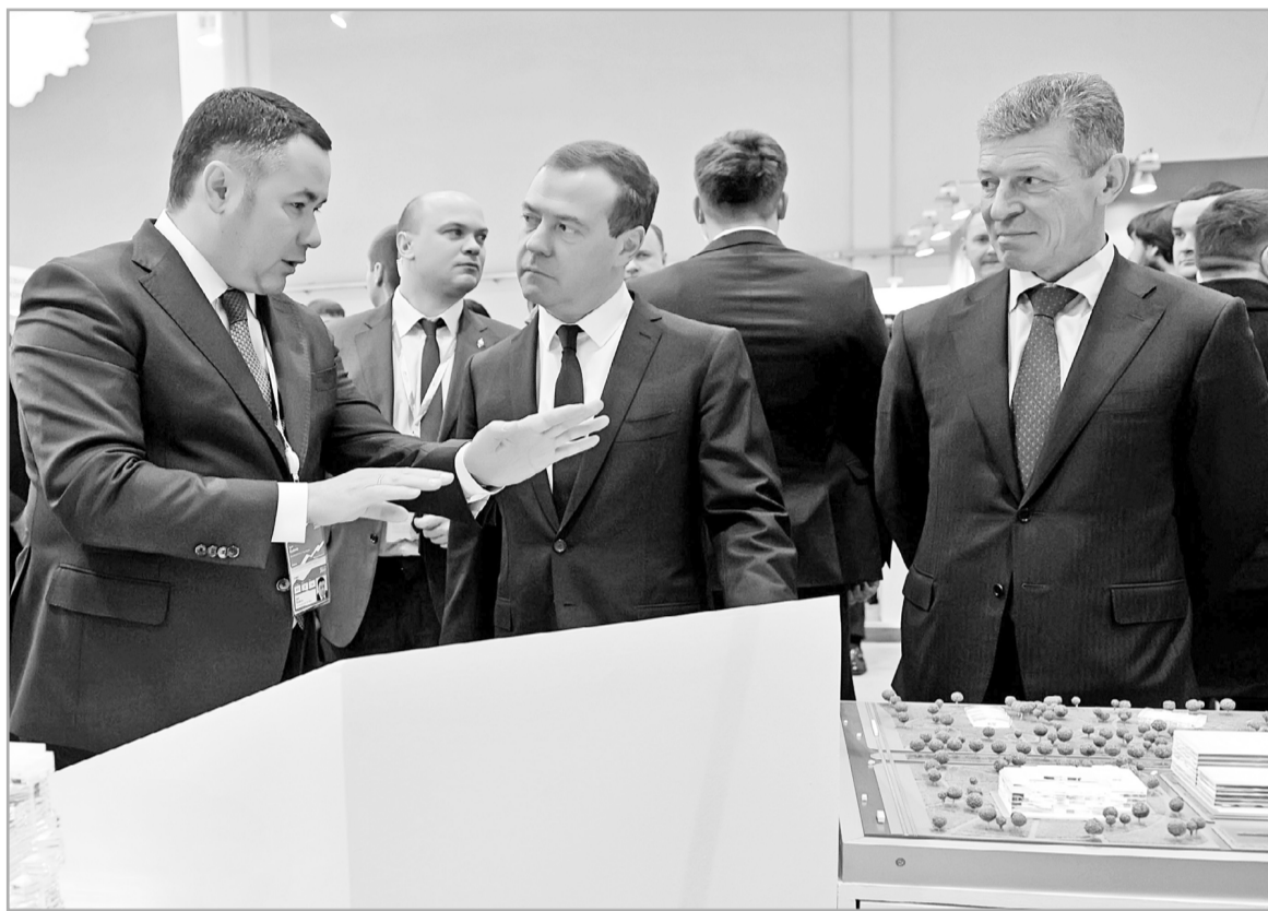
Проекты «Тверь Экспо» и «Тверь Сити» дадут нам новые рабочие места, новые возможности развития города и региона, отметил Игорь Руденя

Новое предприятие будет осуществлять высокотехнологичную переработку рапса,