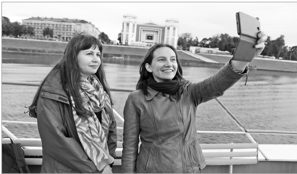
В 2016 году туристический поток в Тверской области оценивался в 1,5 млн человек

Другой существенной проблемой в развитии туристической инфраструктуры является уровень сервиса. В Тверском регионе уже появились гостиницы премиум-класса, а вот вариантов комфортного отдыха для путешественников со средним